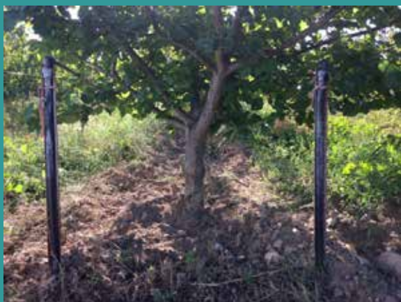
Gainés goutte à goutte surélevées en début de rang