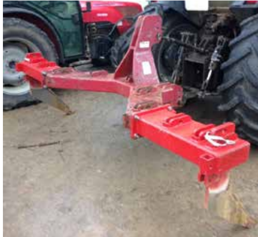
Sous-soleuse deux dents adaptée aux vergers