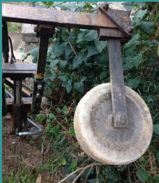
Roue de terrage montée à l'avant du porte-outils