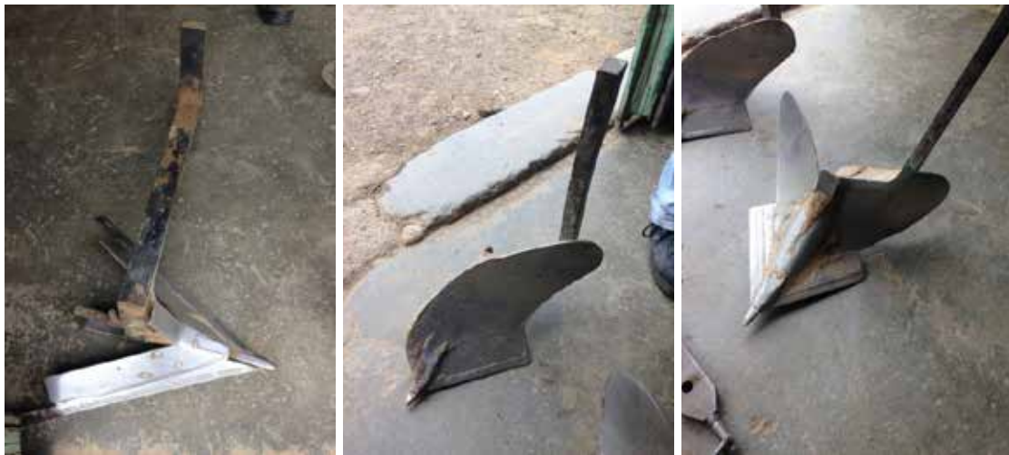
Divers lames et socs

Facilement interchangeables, ils permettent d'intervenir rapidement mais laissent une bande d'herbe au milieu du rang.