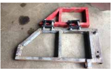
Rallonges pour adapter les outils au porte-outils.

Un système de rallonges permet de déporter plus ou moins les outils.