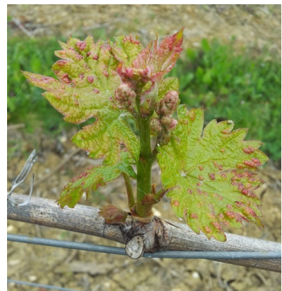
Erinose : dégâts précoce sur jeunes feuilles

Les femelles hivernent dans les écailles des bourgeons et colonisent très tôt les jeunes feuilles pour se nourrir et pondre. Très rapidement après le débournement démarre une phase de reproduction de l'acarien au cours de laquelle seront produites les populations d'adultes des premières générations estivales qui vont migrer vers le bourgeon terminal et les nouvelles feuilles des rameaux. Cette migration démarre fin mai et s'intensifie après la floraison.