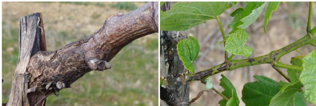
Excoriose : Symptômes sur bois et rameaux

Les attaques apparaissent au printemps, sur les jeunes rameaux, peu après le débourrement, et se manifestent par des taches brun-noir parfois d'aspect liégeux à la hauteur des premiers entre-nœuds.