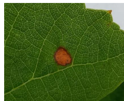
Tâche de black-rot.