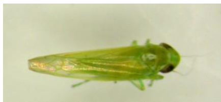
Adulte de cicadelle verte – IFV