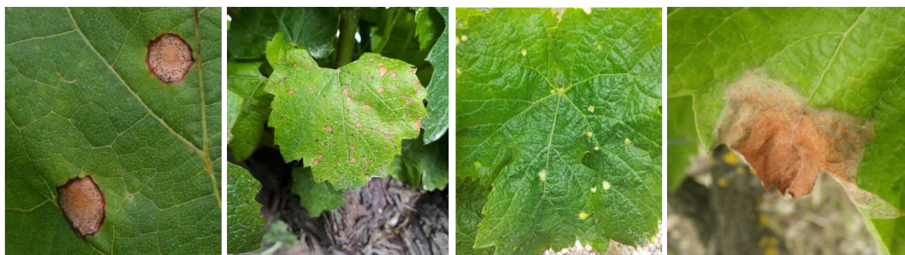
De D à G: Taches de black-rot sur feuilles ( Ephytia ) ; Phytotoxicité d'épamprage chimique (CA81) ; Dégâts de désherbant (CA82) ; Tâche de botrytis (CA81)

A cette période, des symptômes de brûlure du feuillage liés à la dérive de produits désherbants peuvent apparaître. Ces taches sont plutôt d'aspect chlorotique et se distinguent des contaminations de black-rot par l'absence de liseré brun sur le pourtour de la tâche. Afin de confirmer de manière formelle un symptôme de black-rot, il faut attendre l'apparition des pycnides (petits points violets) à la surface des taches soit en laissant la feuille au champ, soit en la mettant en chambre humide.