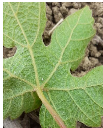
Larve (L1) de Scaphoideus titanus

Évaluation du risque : Les dates d'intervention vont être fixées par la DRAAF.