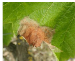
Symptômes de botrytis – photo CA81

Il est représentatif du printemps pluvieux mais ne préfigure pas la présence de botrytis sur grappe.