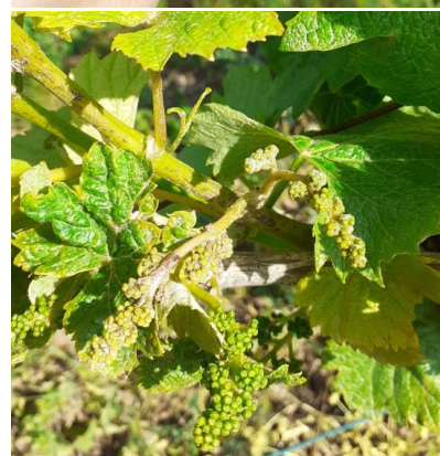
Tâches de mildiou