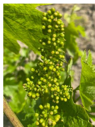
De gauche à droite : Stade 15 : boutons floraux agglomérés sur Mauzac. / Stade 17 : boutons floraux séparés sur Duras / Stade 19 : Tout début floraison sur Gamay