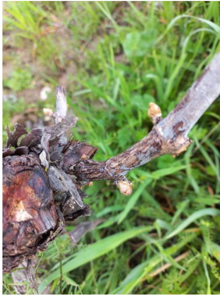
Excoarose : Symptômes sur bois

Des symptômes d'excoarose sur bois d'un an sont régulièrement observés sur divers cépages tels que le Loin de l'œil, le Gamay, le Duras, le Mauzac et la Syrah.