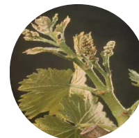
Stade 15 : Boutons floraux agglomérés

La hausse des températures au cours de la semaine écoulée a permis une reprise de la croissance végétative. On relève un allongement important des rameaux sur certains cépages (Syrah). Les stades se sont homogénéisés entre les cépages.