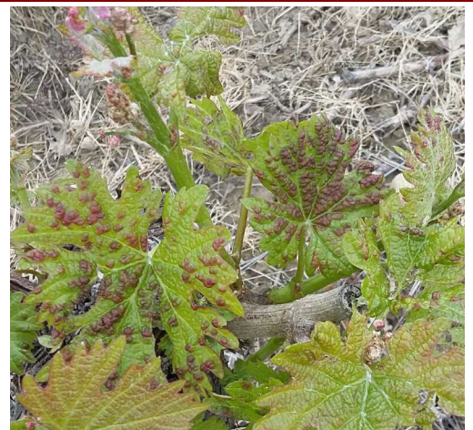
Erinose : Galles sur feuilles jeunes

Évaluation du risque : Des cas d'attaques ponctuellement significatifs sont signalés sur les Cabernets. Surveillez l'évolution des symptômes.