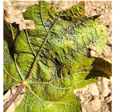
Adultes sur vigne

Pour plus de détails sur cet organisme de quarantaine cliquez ICI .