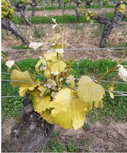
Chlorose : Symptômes sur feuille – photo CA46

Des symptômes de cloroses (Carence en Fer) sont observés.