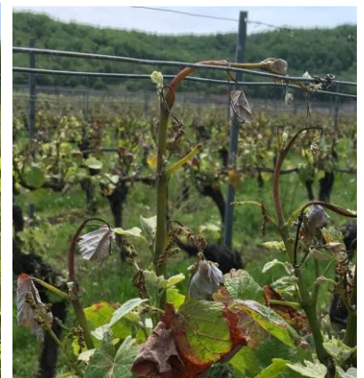
Stade 15 : boutons floraux agglomérés Stade 17 : boutons floraux séparés Apparition d'entre-cœurs (Albas)