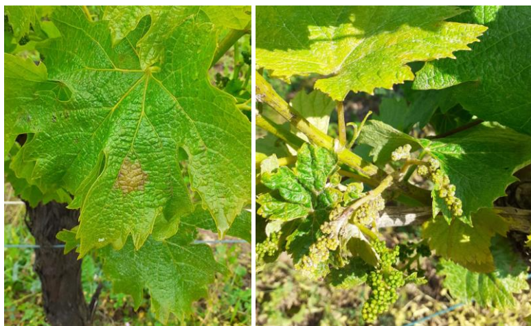
Tâches de mildiou sur feuille et sur grappe

Techniques alternatives : L'utilisation de moyens de bio-contrôle est possible et peut aider dans la gestion du mildiou. Consultez la liste des produits de bio-contrôle en clicquant ici .