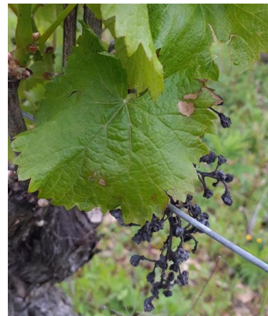
Tâches de black-rot - photo CA46

Surveillez le risque de pluie et restez vigilants sur l'ensemble des parcelles.