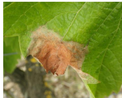
Botrytis : Symptômes sur feuille

Du botrytis est observé de manière régulière sur feuilles. Il est représentatif du printemps pluvieux mais ne préfigure pas la présence de botrytis sur grappe.