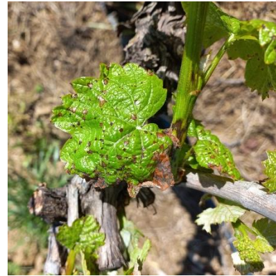
Phytotoxicité de désherbant - photo CA

Des tâches de phytotoxicité au désherbant (type Spotlight) sont signalées.