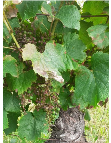
Mildiou sur feuilles sur Côt

Techniques alternatives : L'utilisation de moyens de bio-contrôle est possible et peut aider dans la gestion du mildiou. Consultez la liste des produits de bio-contrôle en cliquant ici .