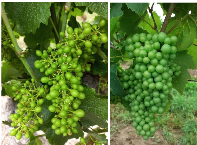
Stade 31 : Grains de pois