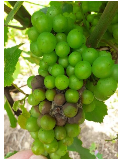
Botrytis sur Chardonnay

Techniques alternatives : L'utilisation de moyens de bio-contrôle est possible et efficace. Consultez la liste des produits de bio-contrôle en cliquant ici .