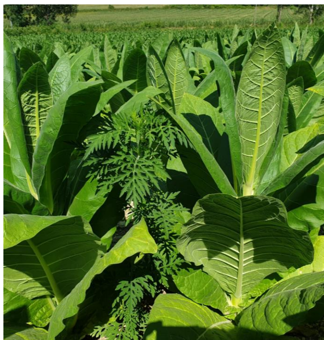
Ambrosie à feuilles d'armoise entre les tabacs

On note une réduction des adventices sur l'ensemble des secteurs et ce malgré des températures chaudes qui favorisent leur développement. En parcelle de référence sur le secteur de Mussig (67) on observe quelques chénopodes (1 plants à 10 plants par m 2 ) et amarantes (1 plants à 10 plants par m 2 ). Enfin, pour le secteur de Sanvensa (12), on signale la présence de graminées, des amarantes (1 plants par m 2 ) et des liserons de l'ordre de 2 %.