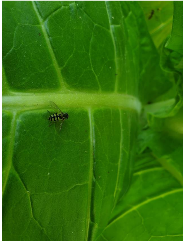
Larve et adulte syrphe sur feuille de tabac

Les structures partenaires dans la réalisation des observations nécessaires à l'élaboration du Bulletin de santé du végétal Grand Sud-Ouest Tabac sont les suivantes : FREDON Nouvelle-Aquitaine - Périgord Tabac - Tabac Garonne Adour - Coopérative CT2F - Oxyane - Traditab