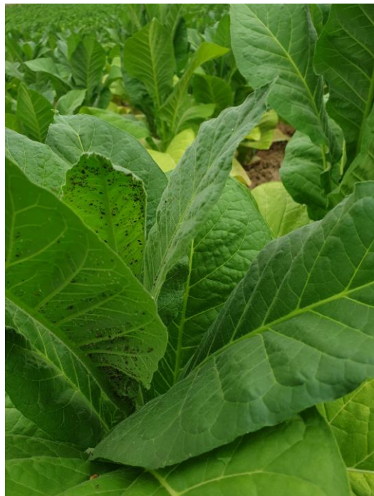
Pucerons sur inflorescences et sur feuilles de Tabac