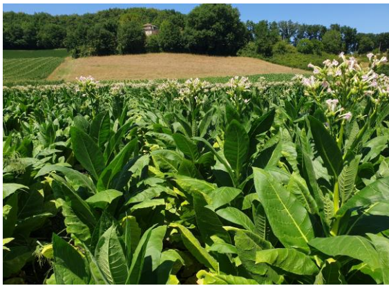
Fleurs de tabac ouvertes

On signale sur la zone de Loupiac-de-la-Réole (33) que le temps chaud est favorable au développement des insectes avec peu de maladies en cours et quelques virus sur des pieds isolés. Dans quelques secteurs on observe que l'orobanche progresse très vite notamment à Schnersheim (67) Chemillé (49) et Vivonne (86). La pression des adventices est en baisse dans l'ensemble des secteurs.