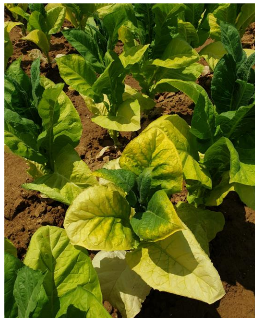
Stolbur sur plant de tabac

Pour le tour de plaine, on signale que la parcelle de Vivonne (86) présente des traces sur 35 ha. Des symptômes sont également présents sur 5 ha dans le secteur de Castelnau-Montratier (46).