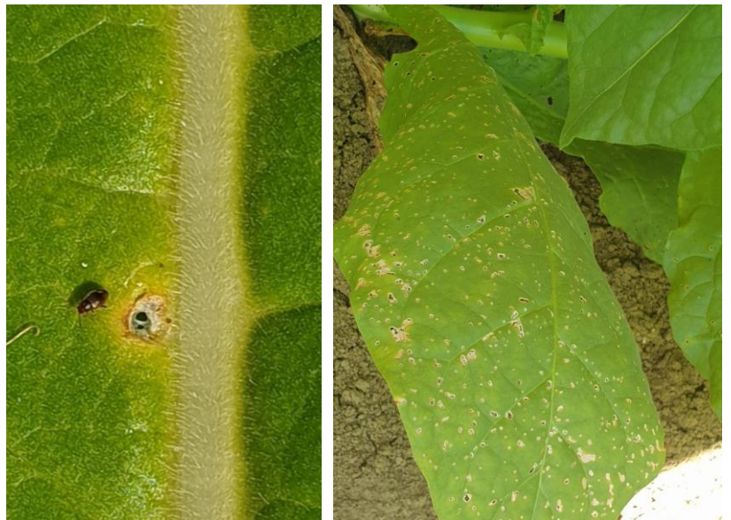
Altise adulte et dégâts d'altises sur feuille de tabac

En tours de plaine, on signale la présence d'altises sur le secteur de Loupiac-de-la-Réole (33) sur 5 ha. Elles sont assez actives sur le secteur de Bourran (47), où l'on note leur présence sur 20 ha avec des dégâts de plus de 20 %.