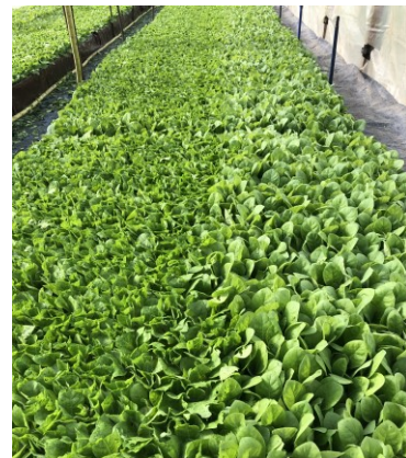
Stade faucillage (à gauche) et 1er faucillage (au milieu et à droite)