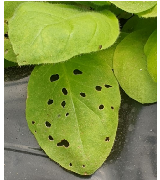
Altises sur jeunes plants de semis