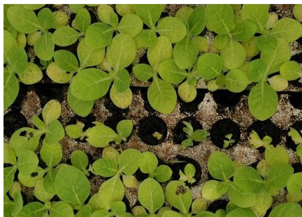
Dégâts de limaces sur semis de tabac

En semis de référence, la présence de limaces est relevée dans les secteurs de Fontaines (85), Frontenay (79) et de Sanvensa (12). En tour de plaine on décèle la faible présence de limaces allant de 1 ha à 5 hectares pour les secteurs de Pujo (65), Castelnau-Montratier (46) et Dordogne (24). Dans le secteur de Loupiac-de-la-Réole (33) on note des traces sur 15 ha. Sur 25 ha leur présence est signalée pour le secteur de Chemillé (49) avec des dégâts de moins 20% sur 8 ha. Enfin, elles sont très présentes sur 55 ha pour la zone de Vivonne (85) avec des dégâts de moins de 20% sur 12 ha.