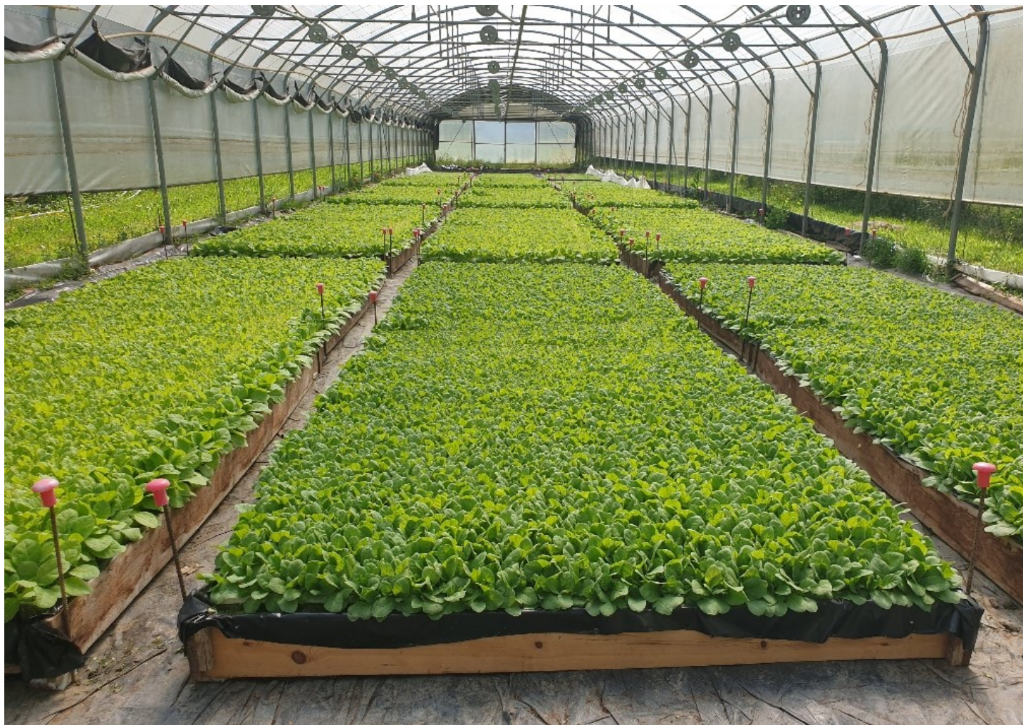
Serre de semis de tabacs

Les relevés de pièges doivent être réalisés régulièrement. Il est encore trop tôt pour mettre en place une gestion de risques liés aux noctuelles terricoles.