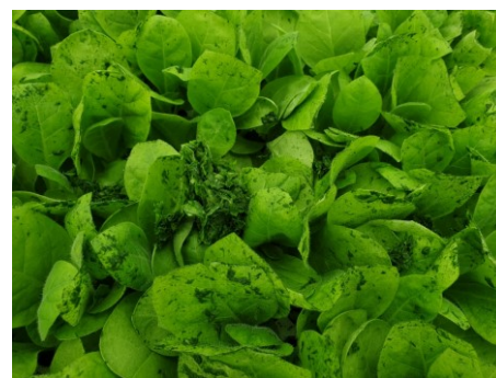
Débris de végétaux à la suite du faucillage

Dans l'ensemble, les plants sont sains, homogènes et prêts à planter. Pour les secteurs de Thuret (63) et de la Dordogne (24), plusieurs stades sont observés allant du stade 4 feuilles (BBCH 1004) au stade bon à planter (BBCH 1060). Sur Sardieu (38), un premier faucillage pour régulariser les plants et une protection fongicide a été mise en place. On remarque des semis en retard pour les secteurs de Loupiac-de-la-Réole (33) et Bourran (47) à cause d'un printemps froid. Pour Beaurepaire (38), on note quelques serres marquées par des coups de chaud avec un décalage lors des premières protections fongicides.