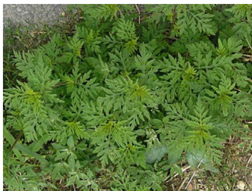
Ambroisie à feuilles d'armoïse en croissance végétative

Les feuilles de l'ambroisie à feuilles d'armoïse sont larges, minces et très découpées, de couleur verte sur les deux faces. Les tiges sont rougeâtres et velues avec à leur sommet des fleurs vert jaunâtre sous la forme de longs épis.