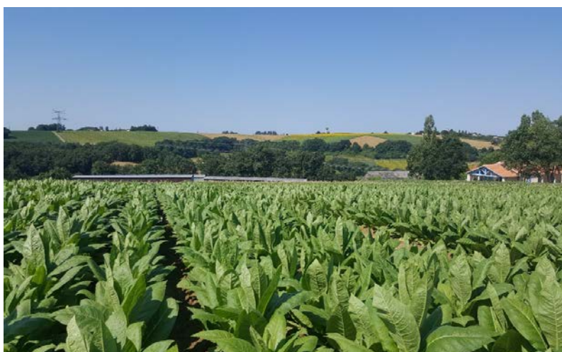
Tabac en cours de montaison

La parcelle de Saint Pierre d'Eyraud (24) est écimée. La récolte des basses sur celle de Loupiac de la Réole (33) a été réalisée. Sur la parcelle de Cuzorn (47), la récolte de Virginie a débuté le 17 juillet et les premières inhibitions ont été réalisées le 21 juillet sur une partie du Burley et une partie du Virginie. Enfin, la parcelle d'Amuré (79) est au stade récolte avec des premiers fous de bonne qualité.