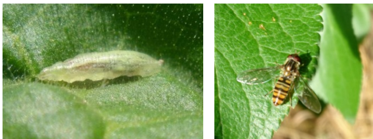
Larve de syrphé et syrphé adulte