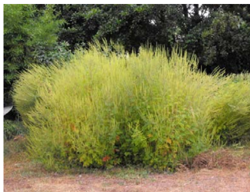
Ambroisie à feuilles d'armoïse au stade floraison