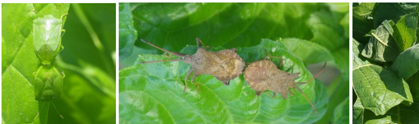
Punaises et feuilles flétries dues à une piqure de punaise