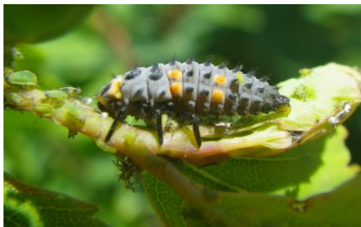
Larves de coccinelles

Elles sont également présentes sur la parcelle de référence d'Amuré (79) à hauteur de 5%.