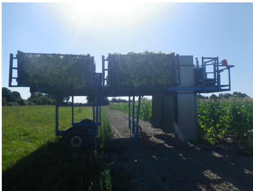
Récolte du Virginie, Loupiac de La Réole (33)