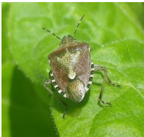
Punaise sur feuille de tabac