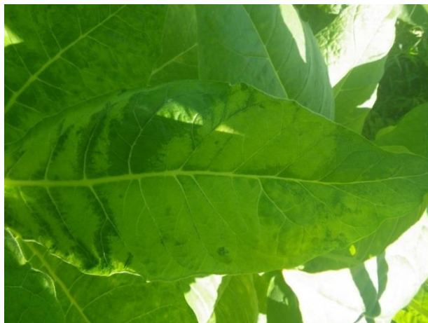
CMV mosaïque du concombre

http://www.aquitainagri.fr/fileadmin/documents_craa/BSV/TABAC/FICHES_BIO-AGRESSEURS/Fiche_Viroses.pdf