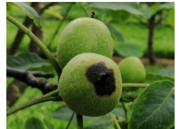
Symptôme de bactériose

Un développement d'anthracoze à Colletotrichum sp. peut parfois s'ajouter sur les taches apicales provoquées par la bactériose qui finissent alors par se crevasser.