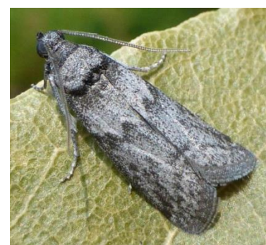
Ectomyelois ceratoniae (Crédit photo : SENURA)

Vous pouvez accéder à davantage de photos en consultant ce lien : http://lepiforum.org/wiki/page/Apomyelois_Ceratoniae .