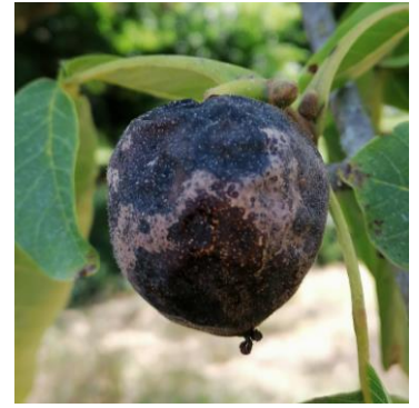
Colletotrichum sp. sur noix

Ces symptômes qui apparaissent en ce moment peuvent être dus à Gnomonia leptospyla via des contaminations secondaires, mais aussi à Colletotrichum sp. via des contaminations primaires puisqu'il nécessite une incubation plus longue.