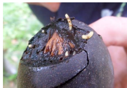
Larves de Rhagoletis completa

Concernant les observations en vergers, quelques dégâts sur noix sont observés : en secteurs précoces, les larves ont déjà atteint un stade avancé prenant leur teinte jaune prononcée.