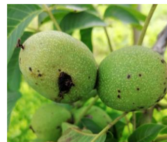
A gauche, dégât de larve de carpocapse

Avec une hypothèse de températures conformes aux normales saisonnières pour les jours à venir, voici ce que le modèle prévoit :