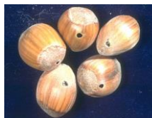
Photo 1 : Balanin mâle adulte – Photo 2 : Noisettes percées par les larves