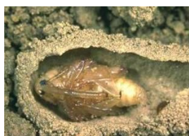
Photo 3 : Œuf au contact de l'amande en cours de croissance Photo 4 : Nymphe femelle dans la loge préparée par la larve dans le sol