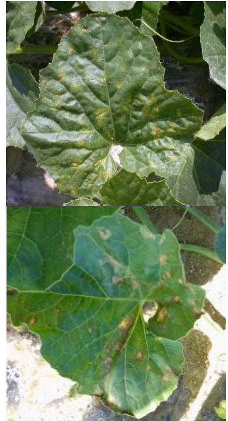
En haut : Cladosporiose – En bas : Bactériose sur feuilles

Dans le sud -ouest, lors des dernières campagnes, excepté en 2021, la cladosporiose a été peu observée. La bactériose reste présente dès que les conditions climatiques sont favorables.