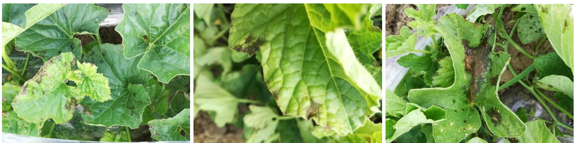
Bactériose sur feuille

Pour la bactériose, il existe un Outil d'Aide à la Décision (OAD) : l'indice de risque bactériose. Il est calculé par le CEFEL à partir de données de températures et de pluviométries pour des cultures « non couvertes ».