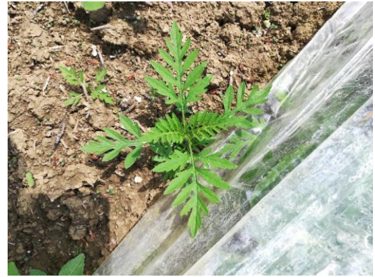
Ambrosie à feuille d'armoise en melonnière, le 15.05.2023 à Belfort de Quercy (46)

Sur terrain non perturbé mécaniquement (culture d'hiver, prairies...), les ambrosies sont également de sortie. Elles pousseront à la faveur des tâches clairsemées où elles profitent de la lumière. Sinon, elles attendront la moisson ou la fauche pour se développer en pleine lumière cet été (Cf photos ci-dessous, Gers et Lozère).