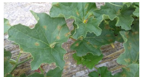
Symptômes de mildiou sur feuilles Photo CA82

Dans le Sud-Ouest, c'est le bio-agresseur le plus présent et ce depuis 2012.