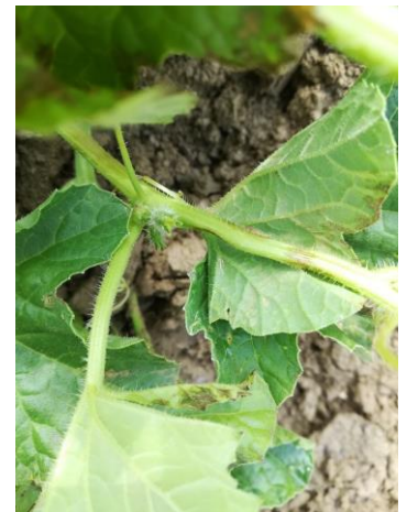
Bactériose sur tige

Mais les aérations sont nécessaires pour limiter les emballements de plantes et favoriser la circulation des insectes pollinisateurs.