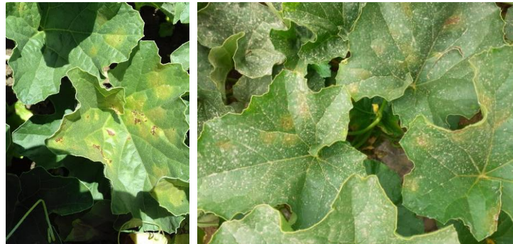
Nouvelles sorties de taches de mildiou sur feuilles (semaine 28)

Malgres les protections fongiques, des taches de mildiou sont encore observées. En majorité, la fréquence d'apparition des nouveaux symptômes est faible.