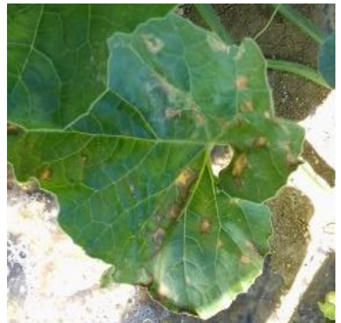
En haut : Cladosporiose – En bas : Bactériose sur feuilles