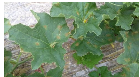
Symptômes de mildiou sur feuilles

Dans le Sud Ouest, c'est le bio-agresseur le plus présent et ce depuis 2012.