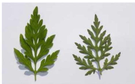
Fig.3. Ambrosie à feuilles d'armoise Feuilles à divisions nombreuses et pennées

L'ambrosie trifide est une plante annuelle 'géante' quand les conditions lui sont favorables. Elle se distingue de l'ambrosie à feuilles d'armoise par une taille plus importante mais surtout par la forme des feuilles qui ne laisse aucun doute pour l'identification de cette espèce.