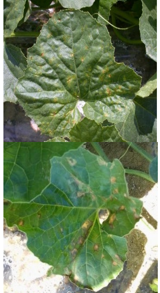
En haut : Cladosporiose – En bas: Bactériose sur feuilles