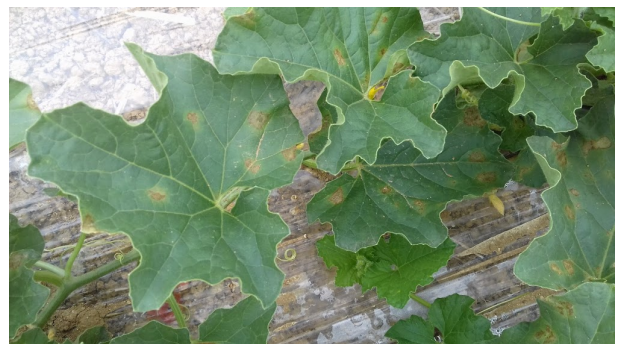
Symptômes de mildiou sur feuilles