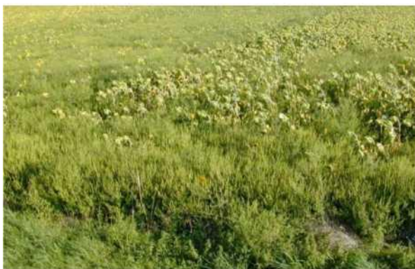
Fig.1. A. artemisiifolia dans la Nièvre (58) : parcelle à stock semencier historiquement important, très forte infestation mal anticipée sur tournesol présentant de surcroît de gros problèmes de levée.