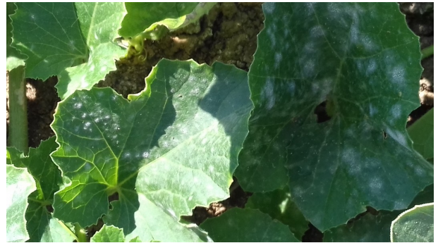
Symptômes d'oïdium sur feuilles