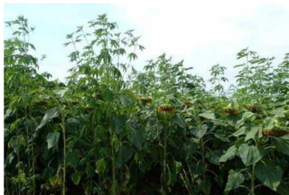
Fig.2. A. trifida dans une culture de tournesol : une géante à apprendre à identifier.