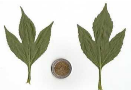
Fig.4. Ambrosie trifide Feuille de 3 à 5 lobes en éventail.