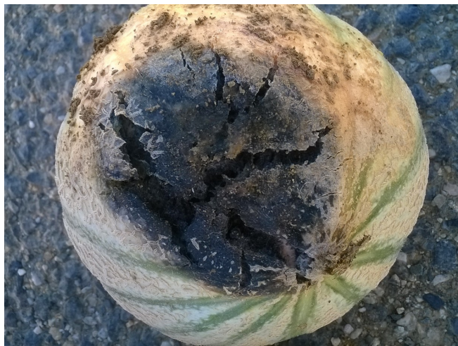
Dégâts de Didymella broniae sur fruit

Les symptômes de pourriture sur fruits sont moins présents cette semaine. Du Didymella broniae a été identifié, analyse à l'appui, sur un échantillon de fruits.