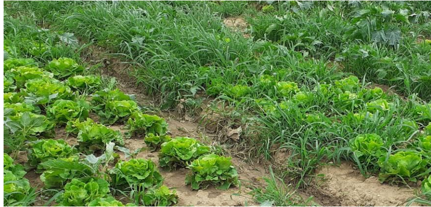
Enherbement salade

La gestion des adventices est majeure actuellement du fait des arrosages importants réalisés et des conditions climatiques toujours chaudes. Les germinations et la croissance de l'herbe (pourpier notamment) sont importantes. Parallèlement, les binages sont parfois difficiles à réaliser à cause des arrosages ou du manque de temps. Cette situation entraîne des pertes en culture, notamment en salades.