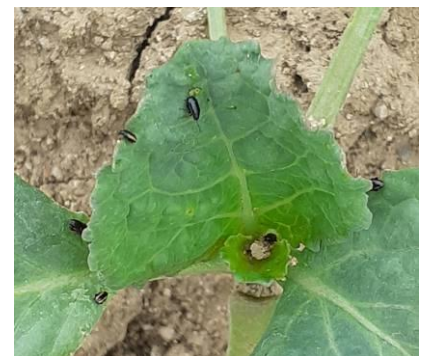
Altises sur chou

Sur les plants protégés, il n'est pas nécessaire d'intervenir tant qu'il n'y a pas de dégâts.