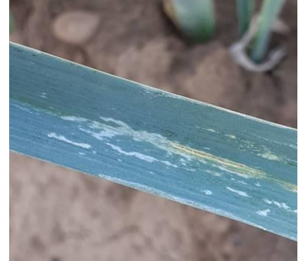
Dégâts de Thrips

Observez plus attentivement les pointes des feuilles pour repérer les individus.