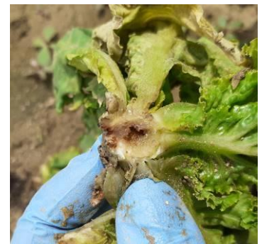
Dégâts de Taupin sur salade