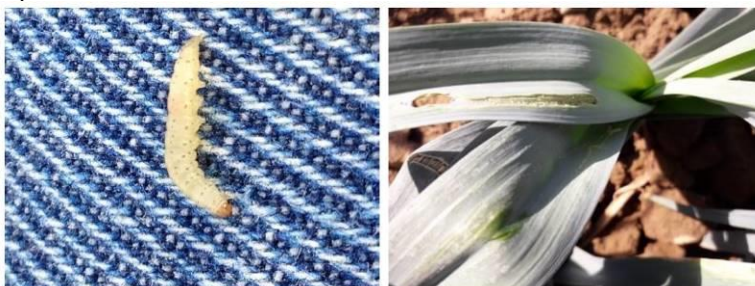
Larve et Dégâts de teigne

Pas de captures sur la parcelle de référence. Pas de dégâts observés en Haute-Garonne. En revanche, ce ravageur est signalé dans le Gers et dans le Tarn avec entre 20 et 30 teignes capturées en une semaine.