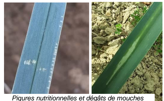
Piqûres nutritionnelles et dégâts de mouches mineuses- Photos CA31

Techniques alternatives : La maîtrise de ce ravageur étant difficile, il est fortement conseillé d'utiliser des filets pour protéger les cultures dès la plantation