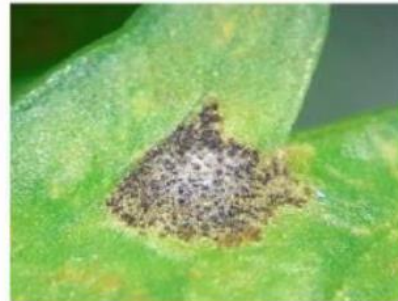
Tâches de Septoriose sur céleri