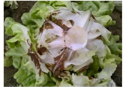
Rhizoctone brun

Mesures prophylactiques : Contrôlez impérativement vos irrigations : pas d'excès d'eau sur les salades bien développées.