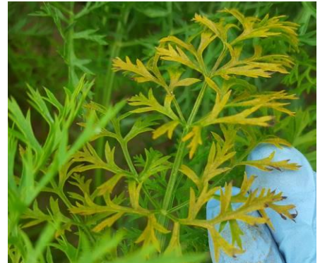
Alternaria - Photo CA31