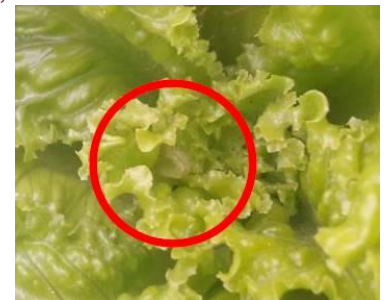
Chenille Autographa Gamma - Photo CA31

Il faut cependant rester vigilant car les captures ont commencé.