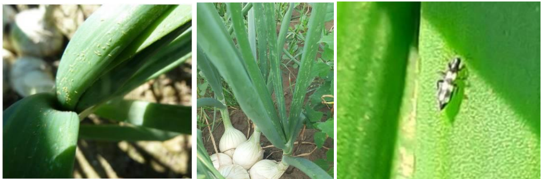
Thrips : larves, adultes et dégâts et Aeolothrips intermedius , dégâts

On observe la présence d' Aeolothrips intermedius , auxiliaires naturels de thrips tabaci . Plus d'infos ici .