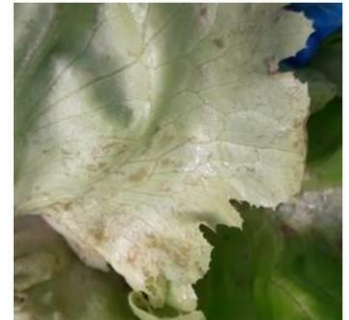
Morsures de thrips - Photo CA31

Surveillez l'apparition de morsures sur les feuilles de la première couronne, notamment sur feuille de chêne blonde (plus apétente vis-à-vis des thrips).