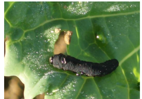
Larve de tenthrède de la rave sur colza

Évaluation du risque : Risque nul à ce jour