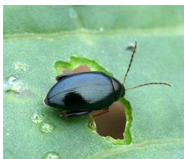
Grosse altise sur colza

40% des parcelles du réseau sont encore en phase de sensibilité. Sur ces parcelles, lorsque l'ensemble des observations sont disponibles, il apparaît que le seuil indicatif de risque est atteint.