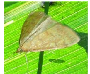
Papillon de pyrale

Période de risque : de 4 feuilles à la récolte