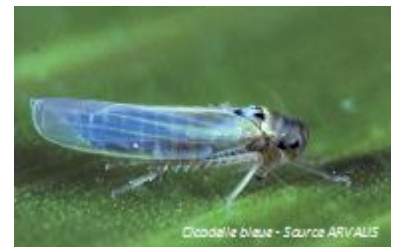
Cicadelle bleue

Seuil indicatif de risque : Atteint quand la feuille de l'épi porte des traces blanches et que les feuilles immédiatement inférieures sont desséchées.