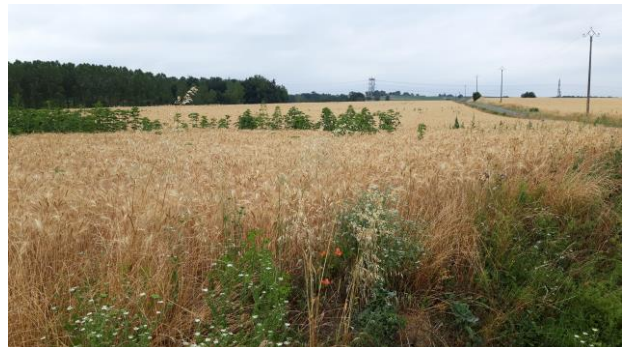
Photo 2 : Rond d'ambrosies trifides vigoureuses ayant dépassé le blé (photo prise le 20/06/2022 en Haute-Garonne)