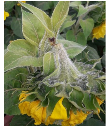
Carence en bore sur tournesol

Pour les derniers semis de tournesol, surveillez vos parcelles.