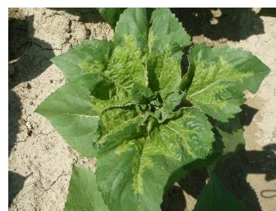
Symptômes de mildiou du tournesol : taches chlorotiques sur face supérieure des feuilles

Si vous rencontrez des situations avec un taux d'attaque significatif (>5 % de pieds touchés en moyenne sur la parcelle), sur des variétés annoncées RM8 ou RM9 contactez votre conseiller afin de réaliser un prélèvement pour déterminer la race présente.