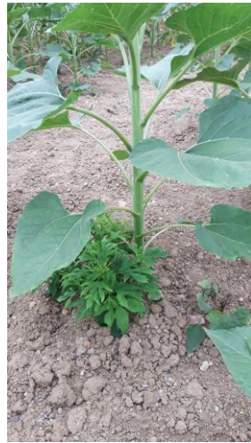
Photo 3 : Ambrosie trifide ayant levé après desherbage (photo prise le 20/06/2022 en Haute-Garonne)

Pensez également à détruire les ambrosies en bordure des champs et contournières (photo 4), pour éviter les re-contaminations. Pour cela, nettoyez les abords de parcelles par fauchage à épiaison des ambrosies, entre mi et fin juillet, et repassez 5 semaines après si nécessaire.