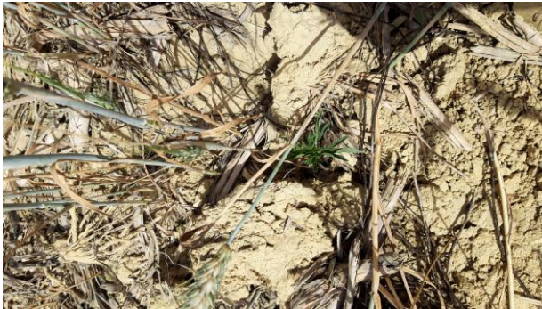
Photo 1 : Ambrosie trifide de petite taille dans le passage d'un tracteur (photo prise le 17/06/2022 dans le Gers)

Comme pour leurs cousines les ambrosies à feuilles d'armoise ( voir BSV n°31 ), les ambrosies trifides dans les cultures d'hiver sont là en attente (photo 1)... ou pas (photo 2) ! Elles mesurent déjà entre 20 cm et 1m et elles ne concurrencent généralement pas les cultures d'hiver.