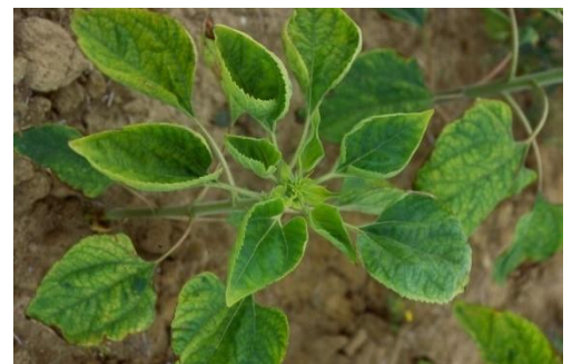
Carence en molybdène sur tournesol

Des symptômes de carence en molybdène ont été rapportés. Il ne s'agit que de cas isolés, cette carence étant principalement inféodée au type de sol (sols acides). Les carences sévères peuvent être corrigées par un apport en végétation.