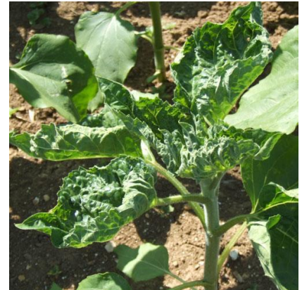
Feuilles crispées dues aux pucerons

Evaluation du risque : Le risque associé au puceron vert du prunier ou au puceron noir de la fève est nul à ce jour.