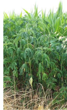
Photo 4 : bord de champ en situation de très forte infestation d'ambrosies trifides (photo prise le 20/06/2022 en Haute-Garonne)