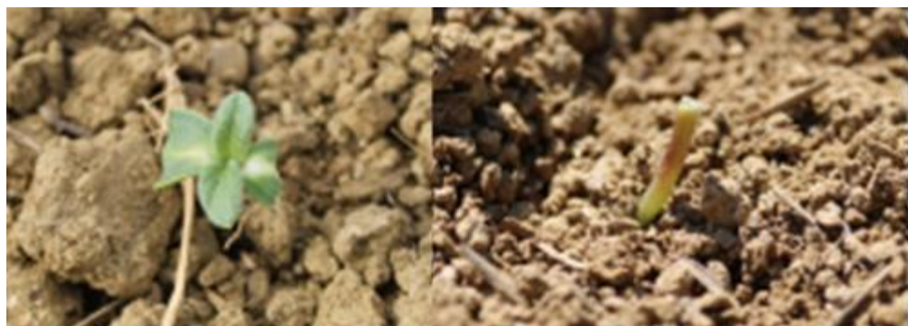
Dégâts d'oiseaux sur plantules de tournesol A gauche, les cotylédons sont touchés mais la plante pourra poursuivre son développement A droite, l'apex par conséquent la plante est détruite

Pour les semis très tardifs réalisés courant juin, il est important de rester vigilant aux attaques d'oiseaux. La surveillance des parcelles et la mise en place d'effaroucheurs paraît être une solution efficace si l'on respecte quelques recommandations (plus d'infos sur terresinovia.fr/tournesol ).