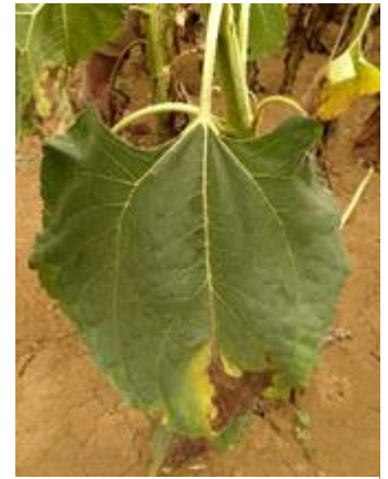
Phomopsis sur feuilles de tournesol

Évaluation du risque : Compte-tenu du niveau de contamination indiqué par le modèle et des conditions humides de la semaine dernière, le risque phomopsis est modéré sur les parcelles qui sont ou seront très prochainement au stade limite passage tracteur.