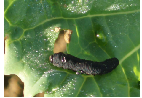
Larve de tenthrède de la rave sur colza.

Seuil indicatif de risque : 25 % de la surface foliaire détruite par les larves de tenthrèdes.