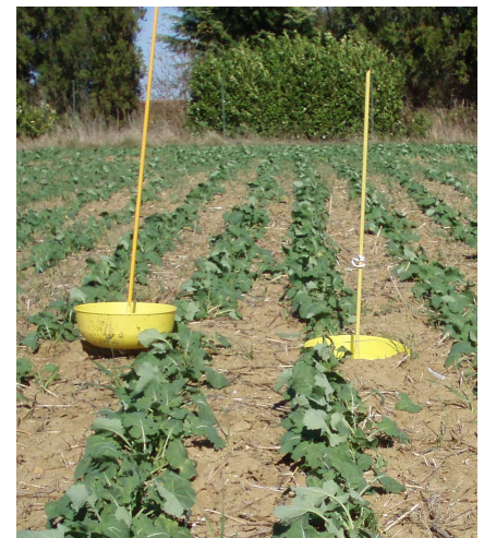
Cuvette jaune en situation.