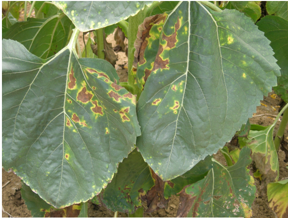
Verticillium sur tournesol.

Attention à la confusion avec les symptômes liés à une carence en bore :