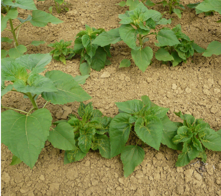
Symptômes de mildiou sur tournesol

Le mildiou est un organisme réglementé. Dans le cadre de l'évolution de la résistance aux traitements de semences, un suivi des races de mildiou est organisé.