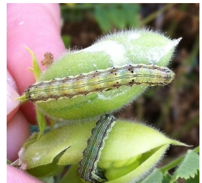
Papillon d' H. armigera