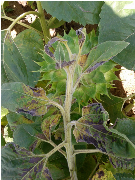
Carence en bore sur tournesol (photo Terres Inovia).

Verticillium : Petites taches jaune vif sur feuilles basses puis chlorose inter-nervaire plus ou moins large. Les tissus finissent par brunir et mourir. Les nervures restent vertes