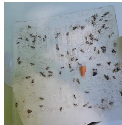
Plaque engluée Producteur à Coussac Bonneval 4 juillet 2022