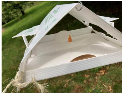
Phéromone attirant les papillons mâles de la tordeuse de la châtaigne, piégés sur une plaque engluée