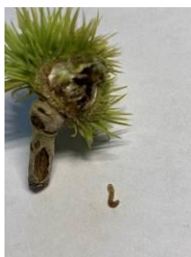
Jeune bogue infestée chutée au sol début août.