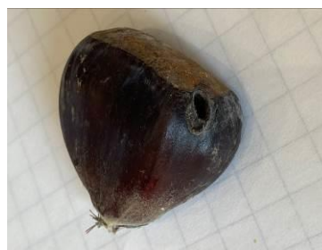
Trou de sortie de la larve de tordeuse à la récolte