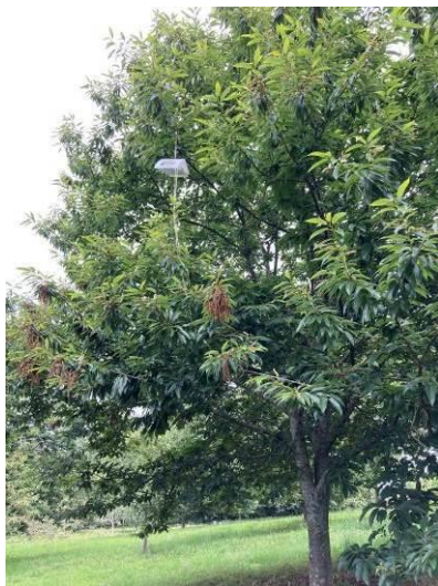
Piège à phéromone posé au plus près des fruits