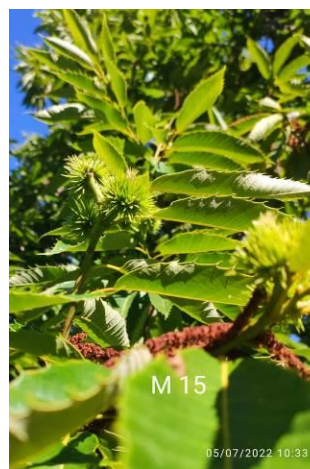
Marigoule à Vergt (24)