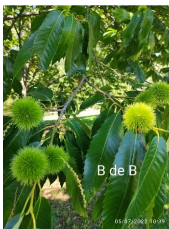
Bouche de Bétizac