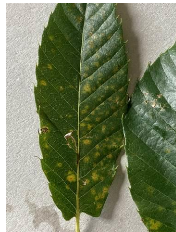
Dégât de septoriose sur feuille 30/09/2021