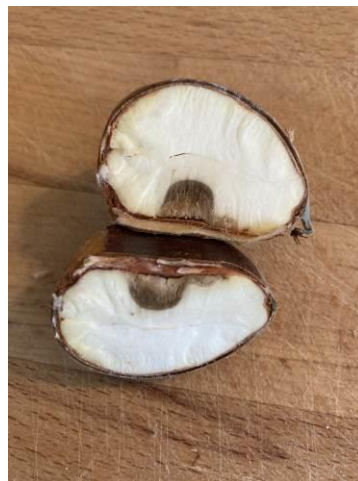
Début de pourriture marron 27/09/2021