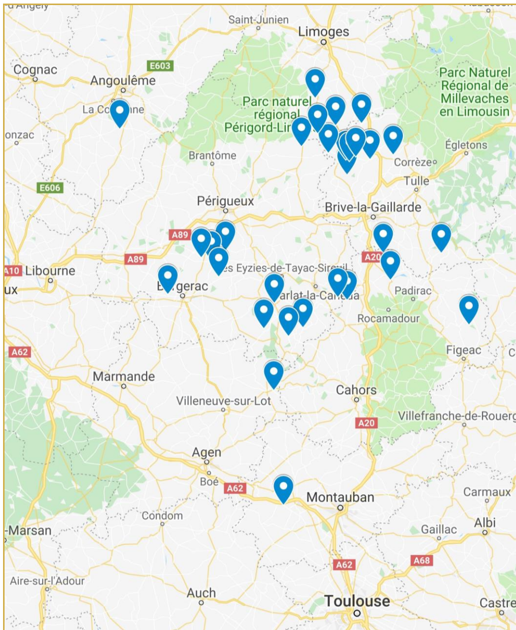
Répartition des communes présentant un ou plusieurs sites de piégeage de Cydia splendana en 2019