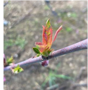
Cloque sur pêcher précoce

Évaluation du risque : Risque moyen à fort en cours sur la majorité des variétés (où le stade sensible Pointe Verte est atteint). Les températures devraient dépasser les 7°C ce qui permet des contaminations en cas de précipitations. Des précipitations sont prévues en fin de semaine ce qui pourrait amener des contaminations.