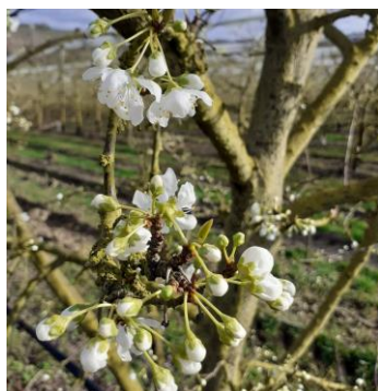
Prune Japonaises, variété Grenadine, Stade E