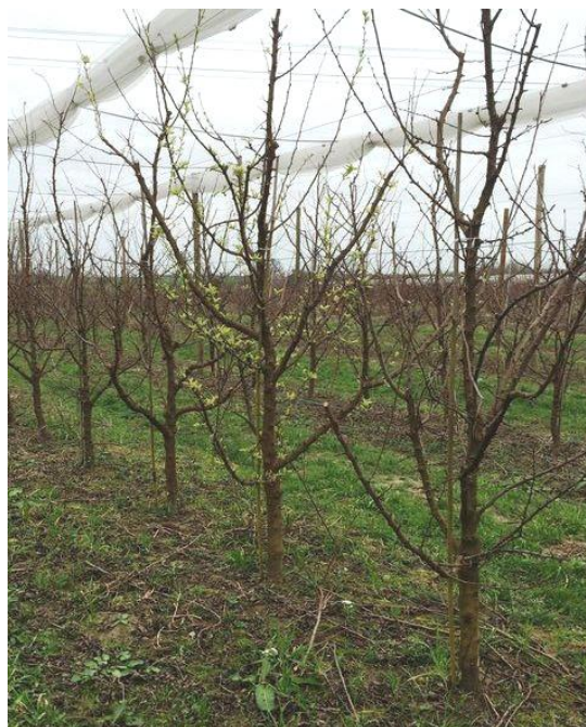
Arbre malade à feuillaison précoce

L'expression des symptômes est importante encore cette année en verger.