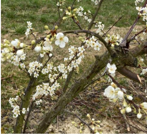
Prune Japonaise, variété Fortune, Stade F Photo Henry Azzopardi 2023