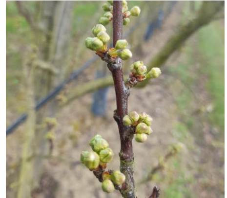
Prune Japonaises, variété Sun Kiss, Stade C Photo Agathe Vallée du Lot 2023