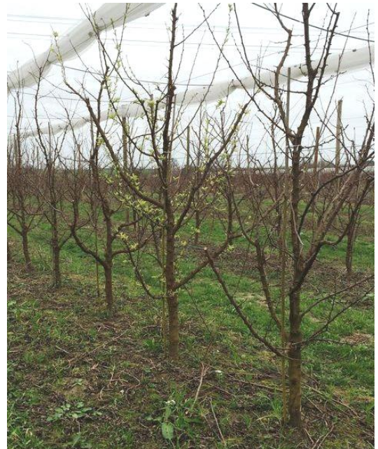
Arbre malade à feuillaison précoce – Photo CA82

L'expression des symptômes est importante encore cette année en verger.