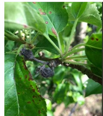
Black rot sur feuilles et momies - Photo Jean-Pierre Abadie

Évaluation du risque : Les périodes de pluie avec des températures douces sont favorables aux contaminations. Le risque est très lié à la parcelle.