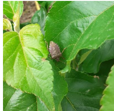
Adulte de punaise diabolique en verger