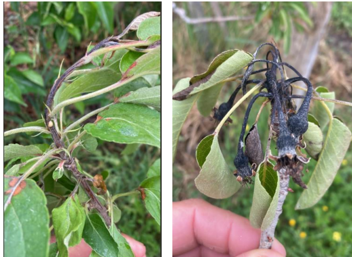
Symptômes de feu bactérien sur pousses (pommier à gauche, poirier à droite)