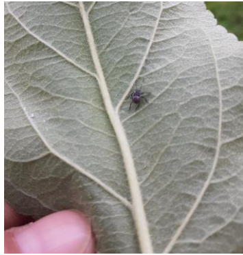
Jeune larve (L1) de punaise diabolique

Évaluation du risque : Risque localisé. A surveiller à la parcelle.