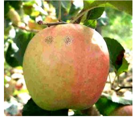
Maladie des « crottes de mouche » Photo CA82

On n'observe pas pour l'instant de sorties de taches.