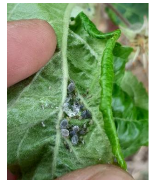
Foyer de pucerons cendrés

Évaluation du risque : fin de la période de risques. Migration en cours