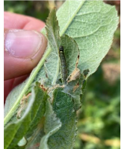
Dégâts et larve de capua sur pousse : feuilles collées entre elles avec tissage blanc