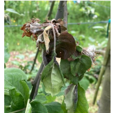
Pousse moniliée

Mesures prophylactiques : La suppression des pousses moniliées permet de limiter l'inoculum.