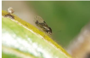
Psylle adulte