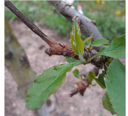
Chancre à nectaria - Photo CA82

Mesures prophylactiques et / ou techniques alternatives : Nettoyer les chancres sur les arbres contaminés. Supprimer les branches trop contaminées lors de la taille.