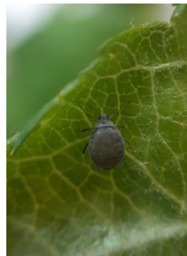
Fondatrice de pucerons cendrés

Nous observons également la présence de formes ailées depuis début juin.