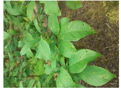
Taches et criblures bactériennes Photos CA82

Évaluation du risque : Risque moyen à fort. Les conditions humide et avec quelques précipitations prévues sont plutôt favorables aux bactérioses.