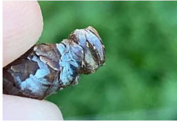
Œufs de psylles

Évaluation du risque : éclosions de la G3 en cours