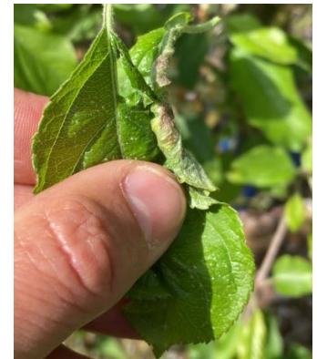
Dégâts de cécidomyies

Évaluation du risque : la période de risque d'éclosions devrait débuter fin juin ; risque sur jeunes vergers (1 ère et 2 ème feuilles)