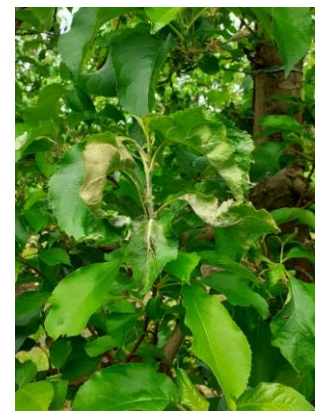
Pousse oïdiée ou « drapeau »

Mesures prophylactiques : La suppression des pousses oïdiées dès leur sortie permet de limiter les risques de repiquages.