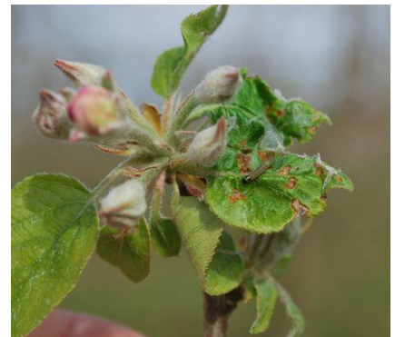
Dégâts et larve de capua avant fleur: feuilles de rosettes collées entre elles avec tissage blanc