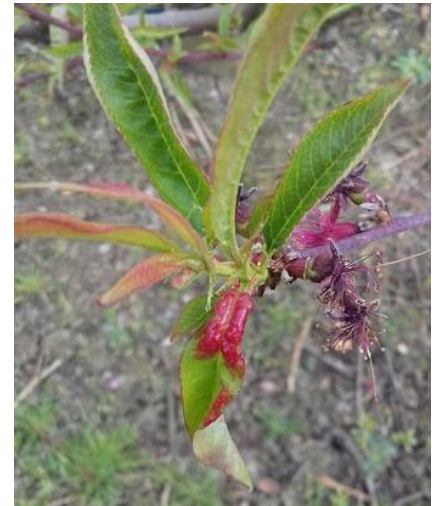
Cloque sur premières feuilles

Évaluation du risque : Une bonne partie des variétés ont déjà une feuille étalée et sont donc sortis du stade sensible. Le stade sensible est en cours sur les autres variétés. Risque faible cette semaine (vent et pas de pluie prévue). Il faudra voir l'évolution de la météo et des stades pour savoir si les variétés seront sensibles lors des prochaines contaminations potentielles.