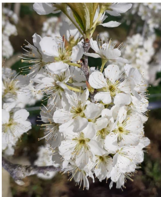
Stade Pleine Floraison sur TC SUN