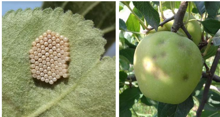
Œufs de N. viridula et dégâts estivaux de punaises sur fruits

Évaluation du risque : Observer les parcelles pour détecter l'éventuelle présence de dégâts.