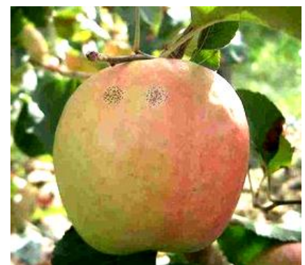
Maladie des « crottes de mouche » Photo CA82