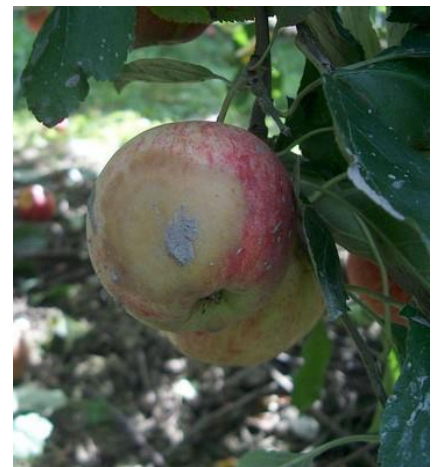
Phytophthora sur fruits

Évaluation du risque : A surveiller, notamment en parcelles peu traitées en fongicides (dont variétés RT).