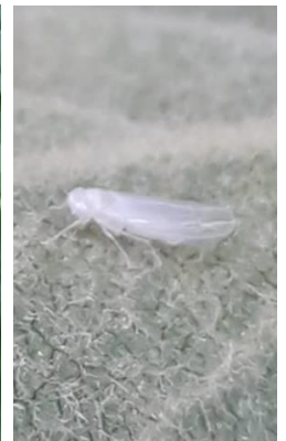
Cicadelle blanche (dégâts et insecte)