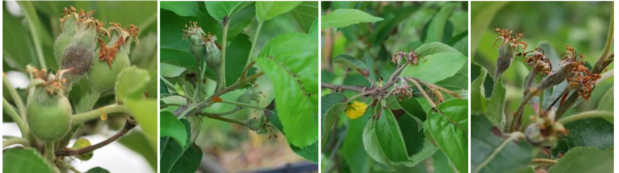
Dégâts de feu bactérien (fin avril 2020)

Nous observons les premiers symptômes au niveau du porte-greffe en vergers jeunes (2 èmes feuilles) et fortement contaminés, depuis le 18 juin.