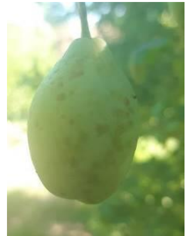
Tavelure sur prune

Évaluation du risque : Risque moyen en cours. Humectation suffisante le matin et portes d'entrées nombreuses avec le cracking ou les dégâts d'oiseaux.