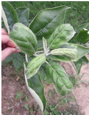
Cicadelle verte (dégâts et insecte)

Évaluation du risque : Pas de risque en verger adulte. Surveillez les jeunes vergers.