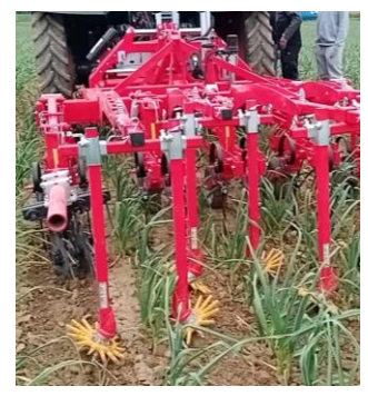
Interventions de désherbage mécanique en cours