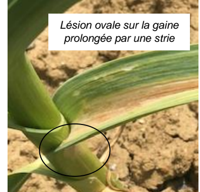
Lésion ovale sur la gaine prolongée par une strie Symptômes de café au lait sur feuillage