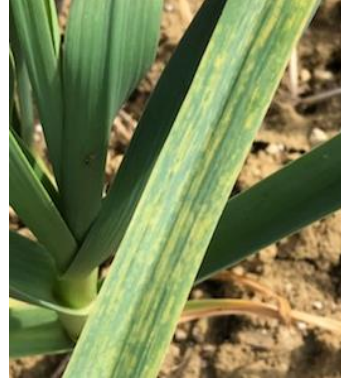
Symptômes de virose sur feuillage