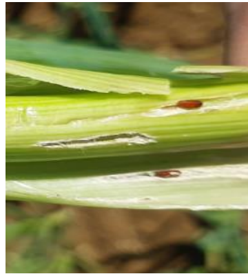
Pupes de mouche à identifier