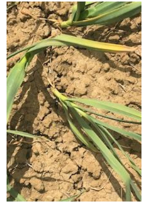
Plants « couchés »