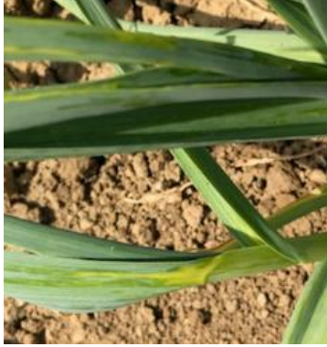
Symptômes d'acariens sur feuillage

Mesures prophylactiques : Voir BSV n°4 .