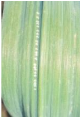
Symptômes de mouche mineuse – Photo CA31

Des parcelles avec des plants « couchés » en raison d'une faible profondeur de plantation et d'un enracinement trop superficiel ont également été observées sur ail rose, secteur Tarn.