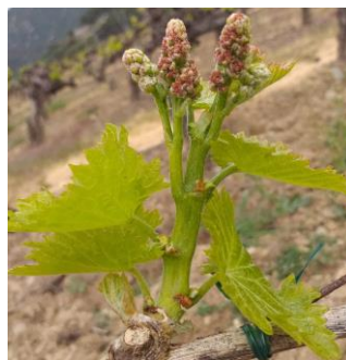
Stade 5 ou 6 feuilles étalées inflorescence visible (stade 12 ou F ou BBCH 14-53)

Les stades majoritairement observés sont compris entre « 5-6 feuilles étalées, inflorescences visibles » (stade 12 ou F ou BBCH 14-53) à « boutons floraux encore agglomérés » (stade 15 ou G ou BBCH 55).