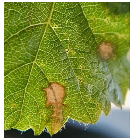
Tache fraîche avec début de fructification

Des taches (sans ou avec des débuts de fructifications) sont découvertes sur parcelles à historique dans les unités agroclimatiques des Haut Coteaux, des Basse et Moyenne Vallée de l'Hérault et du Montpelliérais.