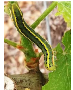
Larve de Xylena exsoleta en train de manger une feuille

Évaluation du risque : risque très faible.