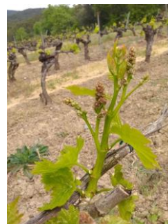
Stade boutons floraux encore agglomérés (stade 15 ou G ou BBCH 55).