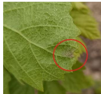
Symptôme sur feuille

Evaluation du risque : le nombre de parcelles avec symptômes est en légère augmentation.