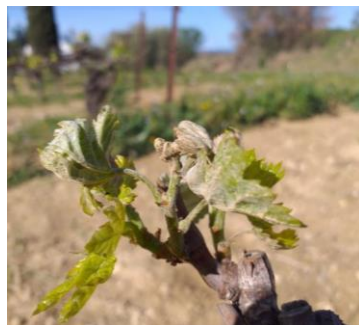
Symptôme drapeau sur Carignan

Les symptômes sur feuilles sont observés sur tout cépages notamment Carignan, Chardonnay, Muscat à petits grains, les Grenaches... Leur fréquence est stable.