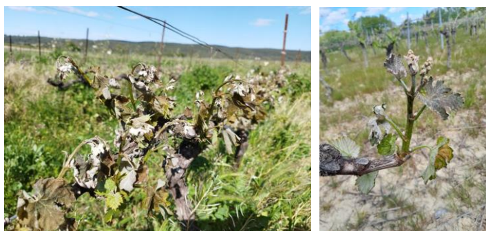
Dégâts de gel

Cette nuit, un autre épisode de gel a pu produire de nouveaux dégâts. Le recensement est en cours.