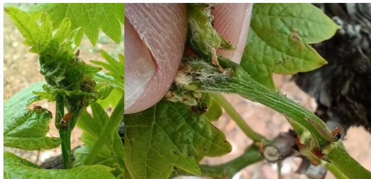
Nid de pyrale

Évaluation du risque : à ce jour, le risque est faible.