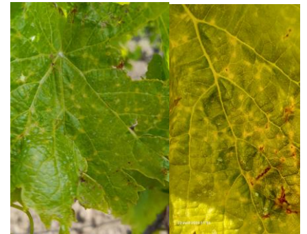
Symptômes d'excoriose sur feuilles de grenache

Des symptômes sur feuilles sont maintenant bien visibles sur différents cépages, notamment dans les parcelles taillées mécaniquement.