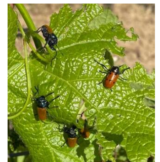
Malcosome du Portugal (sans points noirs) et Lachnaia paradoxa (avec points noirs)