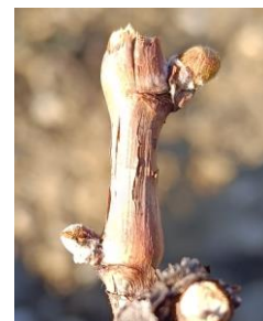
pointe verte (stade 05 ou C ou BBCH 09)