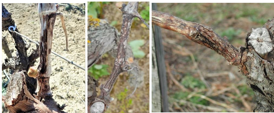
Excoriose : Symptômes sur bois et rameaux – excoriations sévères

Les symptômes sur bois sont visibles et présents notamment dans les parcelles à historique connu. La maladie est toujours présente notamment sur cépages sensibles (Grenaches). Dans nos parcelles de suivis on peut observer jusqu'à 32 % de ceps avec au moins un courson touché. Il ne faut pas confondre les symptômes d'excoriose avec la présence de plages blanchâtres avec présence de champignons saprophytes, probablement liés à des difficultés d'aoutement.