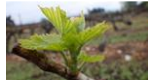
« 2 ou 3 feuilles étalées » (stade 09 ou E ou BBCH 12-13).

Le stade majoritairement observé est de « 2 ou 3 feuilles étalées » (stade 09 ou E ou BBCH 12-13)