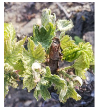
Symptôme drapeau sur Carignan