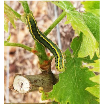
Larve de Xylena exsoleta en train de manger une feuille

Évaluation du risque : il est actuellement faible mais peut augmenter rapidement si forte présence de larves.