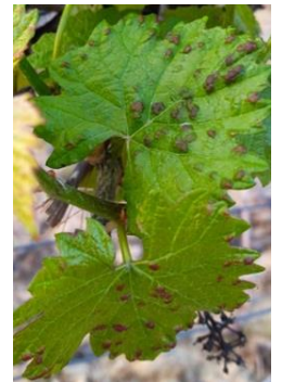
Symptômes avec boursoufflures face supérieure sur cépage Chardonnay

Évaluation du risque : à ce jour, le risque est en légère augmentation