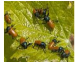
Malacosome du Portugal

Évaluation du risque : risque très faible