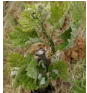
Symptômes d'oidium : drapeau sur Carignan

A cette période de la campagne, surveiller les symptômes et les stades phénologiques des cépages sensibles (Carignan à « drapeaux », Cabernet Sauvignon, Chardonnay, Roussane, Marsanne...).