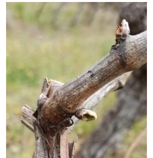
Dégâts de mange bourgeons

Évaluation du risque : le risque reste très faible.