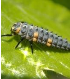
Larve de coccinelle

La faune auxiliaire est présente dans les vignes, on observe notamment des larves de coccinelles.