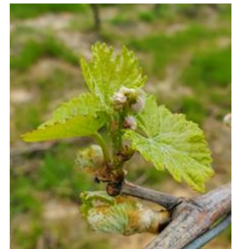
2 ou 3 feuilles étalées (stade 09 ou E ou BBCH 12-13)

Les stades majoritairement observés vont de « 2 ou 3 feuilles étalées » (stade 09 ou E ou BBCH 12-13) à « 5 ou 6 feuilles étalées, inflorescences visibles » (stade 12 ou F ou BBCH 14-53).