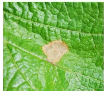
Tache de black rot avec présence de pycnides

Les pluies des 10 et 11 mai puis celles des 13 et 14 mai peuvent avoir engendré de nouvelles contaminations et/ou des repiquages. Ces nouveaux symptômes pourraient