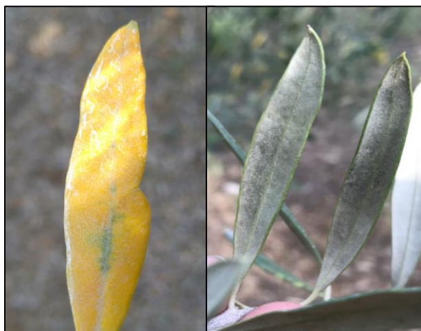
Symptômes de cercosporiose