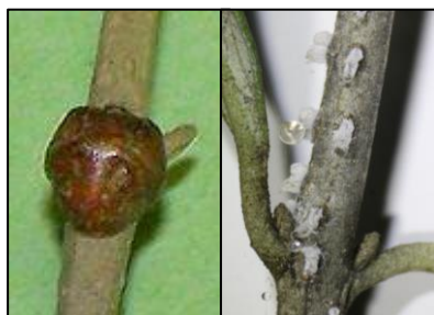
Cochenille noire Stade L3 à gauche Filippia follicularis à droite

Les cochenilles sont des insectes piqueurs-suceurs très polyphages (non spécifiques à une plante hôte) de la super famille des Coccoidea qui regroupe plusieurs familles. La famille des Coccidae (cochenille à carapace) avec notamment la cochenille noire de l'olivier ( Saissetia oleae ) et plus rarement Filippia follicularis est la plus fréquemment rencontrée dans les vergers d'oliviers en France.