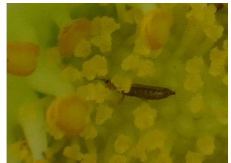
Thrips sur fleur - Photo CA30