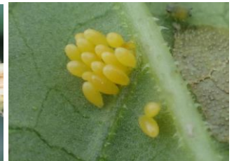
Symptômes de virose sur feuille et fruit – Larve et œufs de coccinelle - Photos CA30