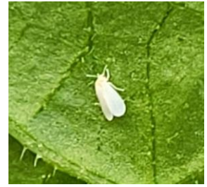
Aleurodes sur tomate

Techniques alternatives : L'utilisation de moyens de bio-contrôle est possible et efficace notamment en les localisant sur les foyers. Liste des produits de bio-contrôle . Contacter votre technicien.