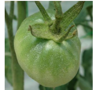
Dégâts acariens