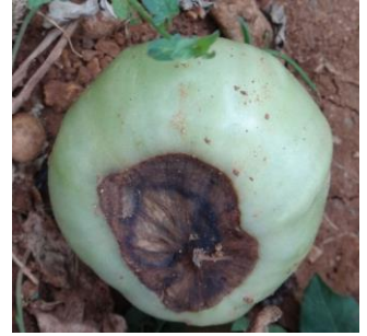
Nécrose apicale – Photo CA30