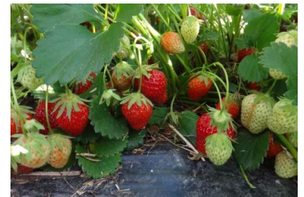
Récolte Charlotte Plein champ

Nous observons toujours la présence de pucerons, notamment au niveau des cœurs, et les populations évoluent aussi bien en bio qu'en conventionnel. On note la présence d'auxiliaires indigènes comme les coccinelles mais aussi des aphidius (momies de pucerons), des syrphes et des praons dans les tunnels..... Cependant, dans certains cas cela ne suffit pas pour contenir les populations de pucerons.