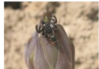
Mouche de l'asperge - Photo SUDEXPE

La mouche de l'asperge se reconnaît grâce à ses ailes blanchâtres avec une bande noire en zigzag. La femelle pond sur les écailles terminales de la plante et la larve creuse une galerie dans la tige. Celle-ci brunit le long de la partie attaquée puis jaunit et meurt.