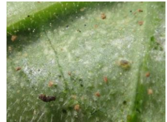
Dégâts acariens - Photo CA30

Nous observons des dégâts d'acariens. Pour le moment les populations sont peu importantes en plein champ, mais elles évoluent rapidement sous abris. Sous abris, les lâchers de Phytoseiulus persimilis (acariens prédateurs) marchent bien pour réguler les acariens et sont à renouveler régulièrement.