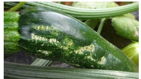
Fruit abimé par le vent – Photo CA30

En plein champ, suite aux périodes ventées nous observons toujours beaucoup de griffures sur les fruits.