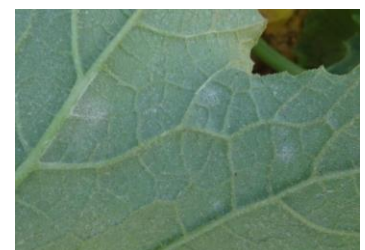
Oïdium sur courgette

Évaluation du risque : Risque en forte augmentation.