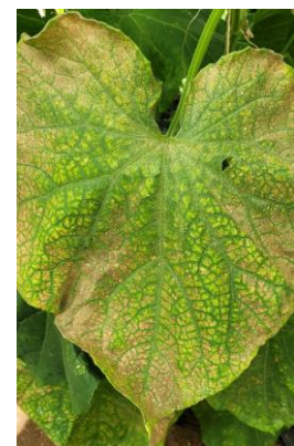
Attaque d'acariens

- Possibilité de faire des bassinages en journées ensoleillées. Le feuillage doit rester sec la nuit.