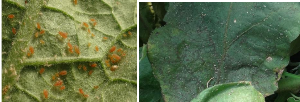
Foyer de pucerons – Fumagine