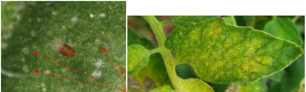
Acariens (forme mobile et œufs) - Dégâts sur tomate