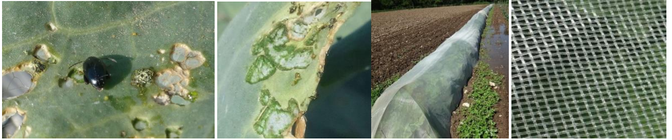
Altises – Dégâts - Filets - Photos CA30

En particuliers en Bio, dès la reprise des plants nous observons dans la plupart des cas des attaques importantes d'altises... comme chaque année.