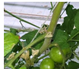
Acariose bronzée

Techniques alternatives : L'utilisation de moyens de bio-contrôle est possible et efficace. Liste des produits de bio-contrôle . Contacter votre technicien.