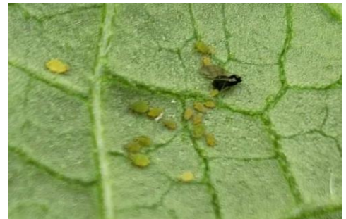
Foyer de pucerons

- Choisir de préférence des variétés IR Ag : résistance intermédiaire à la colonisation par le puceron Aphis gossypii .