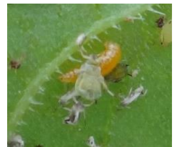
Larve orange de cécidomyie