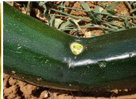
Larve de noctuelles – Dégâts fruits coudés