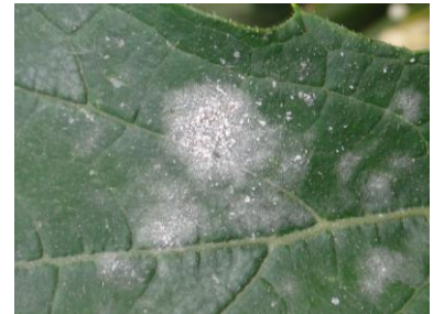
Oïdium - Photo CA30