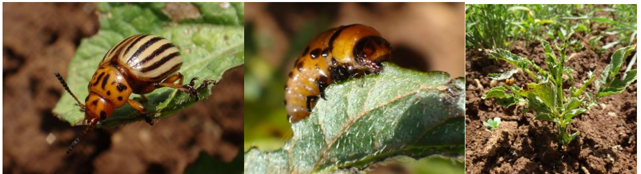
Adulte et larve de Doryphores et dégâts