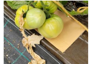
Protection taupin sur tomate

Techniques alternatives : utilisation de moyens mécanique comme la mise en place d'une protection en carton pour les fruits qui touchent le sol.