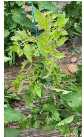
Dégâts TSWV sur tomate

- Arracher les plants atteints par le TSWV et les sortir de la serre