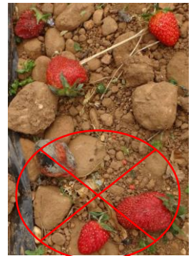
Ne pas laisser trainer les fruits

Techniques alternatives : L'utilisation de moyens de bio-contrôle est possible et efficace. Liste des produits de bio-contrôle . Contacter votre technicien.