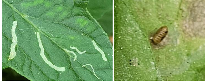
Galerie de mineuse – Pupa

Evaluation du risque : Risque en augmentation