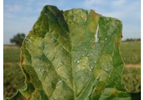
Mildiou - Photo CA30

Ce pathogène apprécie particulièrement les fortes hygrométries survenant en périodes de brouillards, de rosées, de pluies et d'irrigations par aspersion. La présence d'eau libre sur les feuilles est indispensable à l'infection qui a lieu.