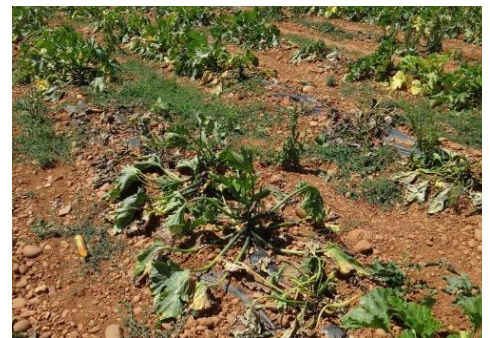
Fusariose – Photo CA30

Mesures prophylactiques : Faire des rotations