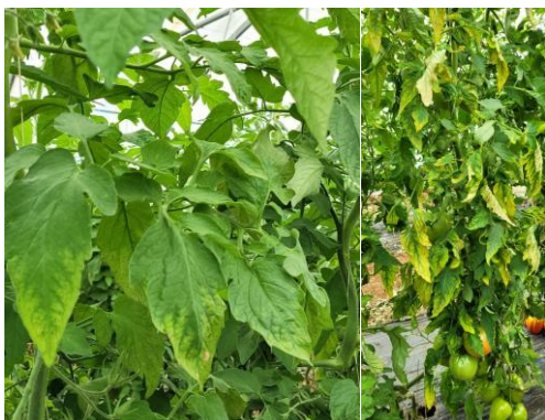
Carence potasse

Evaluation du risque : Risque en augmentation