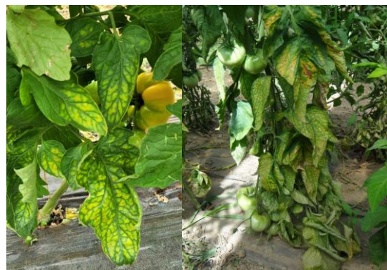
Carence Magnésie - Photos JEEM-CA30