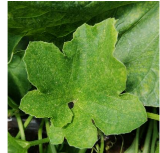
Attaque acariens