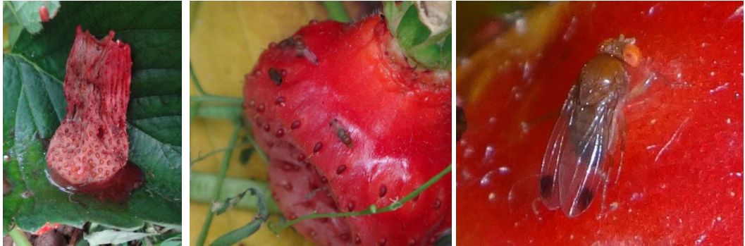
Dégâts Drosophila suzukii – Adultes de Drosophila suzukii