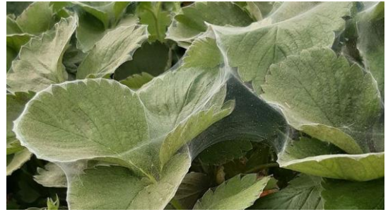
Gros foyers d'acariens

Nous observons toujours de manière régulière la présence d'acariens (adultes et œufs), particulièrement en bio. Les attaques s'intensifient et dans certains cas extrêmes on arrive à la forme de toile.