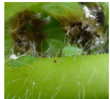
Foyer de pucerons - Photo CA30