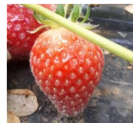
Oïdium sur fruit

Techniques alternatives : L'utilisation de moyens de bio-contrôle est possible et efficace. Liste des produits de bio-contrôle . Contacter votre technicien.