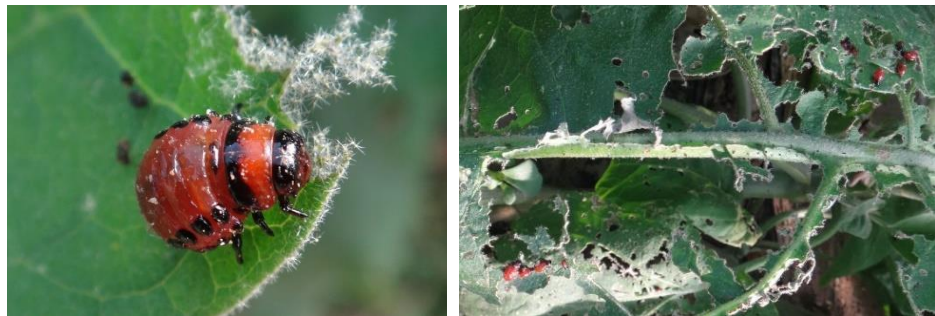
Larve de doryphores et dégâts