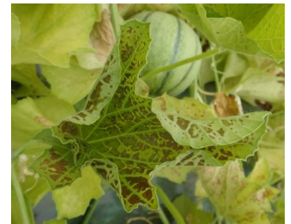
Grille physiologique – Photo CA30

Techniques alternatives : Utilisation possible en foliaire dès le stade abricot de produit à base de nitrate de calcium (2 à 3%) ou de sulfate de magnésium (3 à 6%).