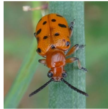
Crioceris asparagi – Crioceris duodecimpunctata - Photos CA30