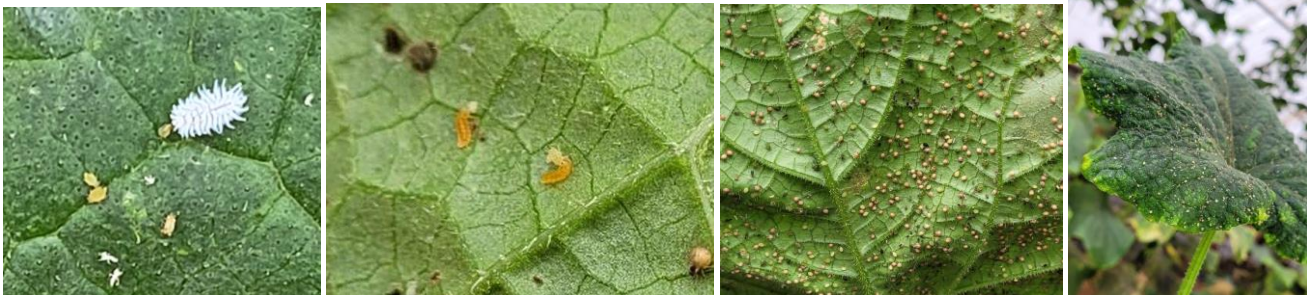
Coccinelle Scymnus – Cécidomyies mangeant des pucerons – Bon parasitisme – Foyers de pucerons

- Il est possible de faire des lâchers de parasitoïdes comme Aphidius colemani (vrac ou plantes relais), Aphidius ervi et Aphelinus abdominalis . Possibilité de faire aussi des lâchers de prédateurs comme Aphidoletes aphidimyza (larve orange sur la photo ci-dessous) et les coccinelles