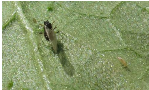
Virus sur feuilles - Pucerons sur courgette - Photos CA30