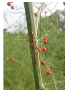
Rouille de l'asperge

Les conditions climatiques sont favorables au développement de la rouille ( Puccinia asparagi ) et plusieurs cas sont observés.