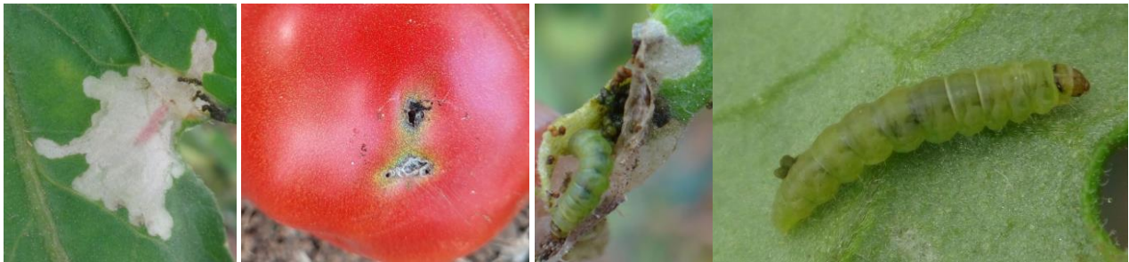
Dégâts de Tuta sur tomate – Larve – Confusion sexuelle – Piège Tuta - CA30

Mesures prophylactiques : enlever les adventices hébergeant de la Tuta aux abords des cultures.