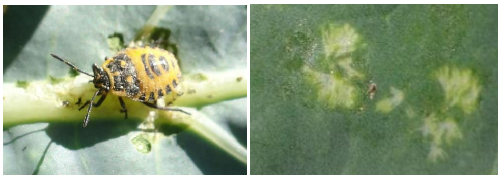
Punaises – Dégâts - Photos CA30