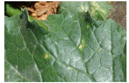
Cladosporiose – Photo CA30

Évaluation du risque : Risque en augmentation