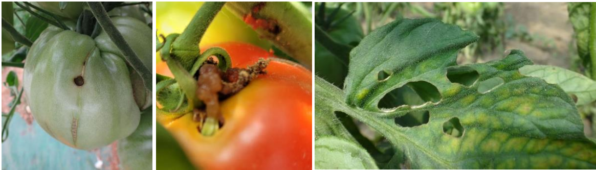
Dégâts de noctuelles sur fruits et feuilles - Photos CA30 et JEEM

- . L'utilisation de moyens de bio-contrôle est possible et efficace notamment en les localisant sur les foyers. Liste des produits de bio-contrôle.