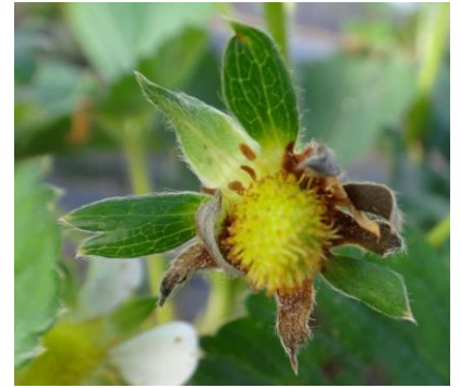
Botrytis sur fleur – Photo CA30

Techniques alternatives : L'utilisation de moyens de bio-contrôle est possible et efficace. Liste des produits de bio-contrôle . Contacter votre technicien.