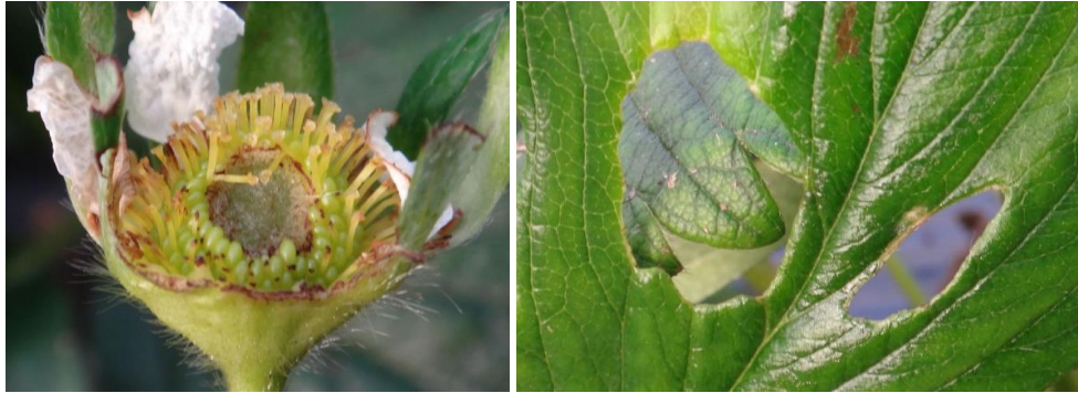
Dégâts de chenilles

Techniques alternatives : si présence importante, l'utilisation de moyens de bio-contrôle est possible. Liste des produits de bio-contrôle . Contacter votre technicien.