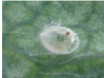
Puparium de trialeurodes - Photo CA 30

Techniques alternatives : Il est possible de mettre en place de panneaux englués jaunes pour faire de la détection mais aussi pour faire du piégeage d'adultes