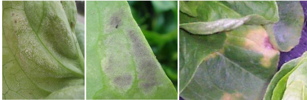
Bremia – Photos CA30

Techniques alternatives : L'utilisation de moyens de bio-contrôle est possible pour freiner le développement de la maladie. Liste des produits de bio-contrôle . Contacter votre technicien.