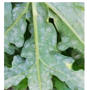
Oïdium sur artichaut

Techniques alternatives : L'utilisation de moyens de bio-contrôle est possible. Liste des produits de bio-contrôle . Contacter votre technicien.