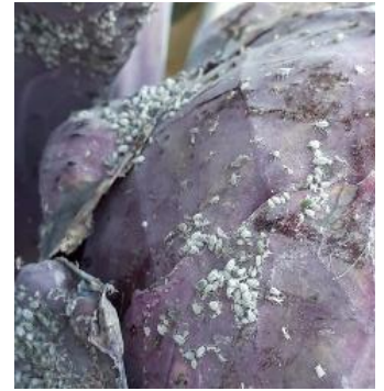
Puceron cendré sur chou

Voir la fiche « les auxiliaires sur choux »