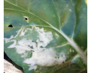
Mineuses sur blette