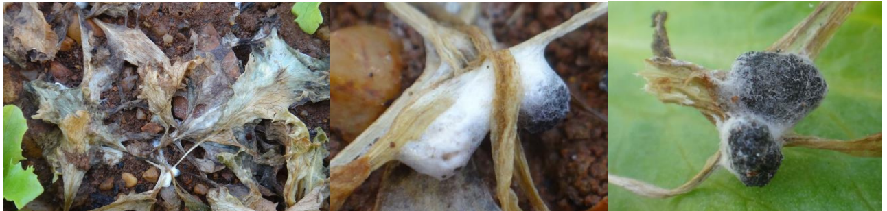
Sclérotinia et sclérotés

Techniques alternatives : L'utilisation de moyens de bio-contrôle est possible. Liste des produits de bio-contrôle . Contacter votre technicien.