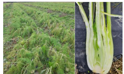
Gel sur fenouil

Évaluation du risque : Risque en augmentation