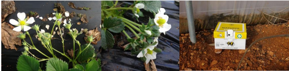
Début floraison Trays plants – Pose des 1ères ruches

Suivant les secteurs, les besoins en froid de certaines variétés peuvent être acquis et la levée de dormance peut s'opérer. En tunnel froid, pour les plus précoces, les fleurs arrivent et les 1ères ruches sont en train d'être posées.