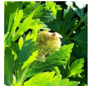
Dégâts de mouche sur céleri

Évaluation du risque : Risque en diminution