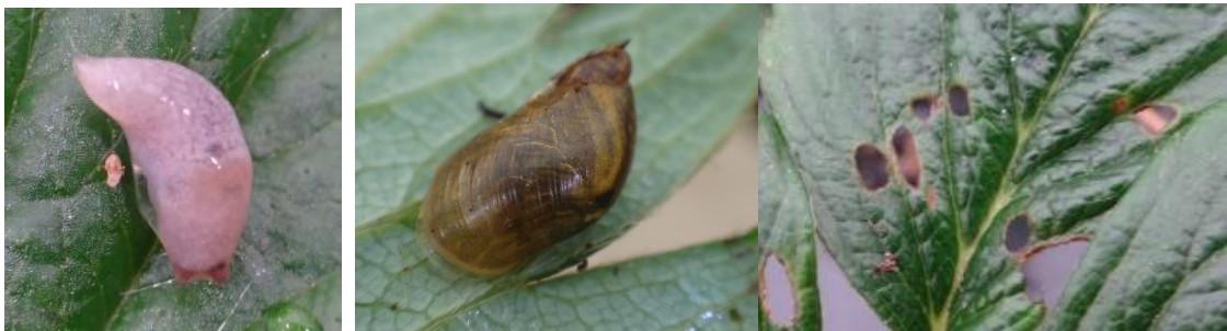
Petite limace – Petit escargot et dégâts

Techniques alternatives : si présence importante, l'utilisation de moyens de bio-contrôle est possible. Liste des produits de bio-contrôle . Contacter votre technicien.