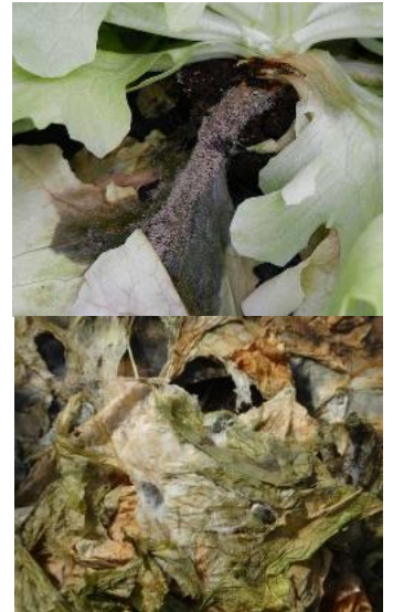
Botrytis – Sclerotinia – Photos CA30