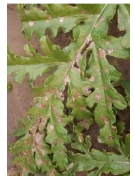
Mildiou sur artichaut