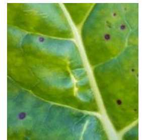
Cercosporiose sur blette