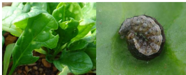
Dégâts de noctuelles

Techniques alternatives : L'utilisation de moyens de bio-contrôle est possible. Liste des produits de bio-contrôle . Contacter votre technicien.