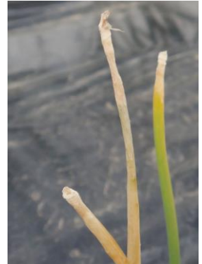
Botrytis sur oignon