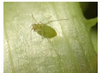
Pucerons - Photo CA30

- L'utilisation de moyens de bio-contrôle est possible. Liste des produits de bio-contrôle . Contacter votre technicien.