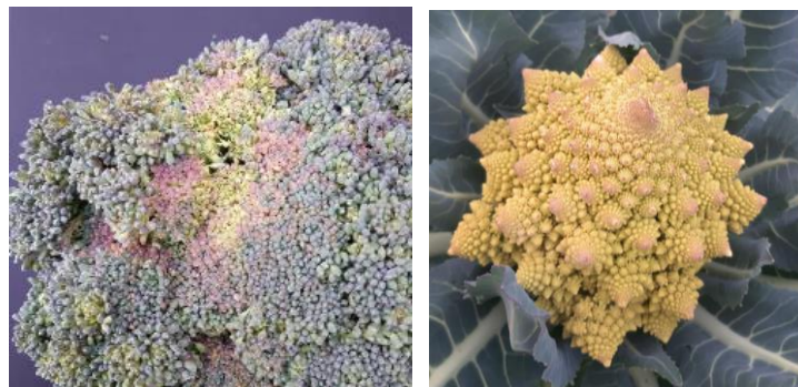
Gel sur brocoli et Romanesco

Évaluation du risque : Risque en augmentation