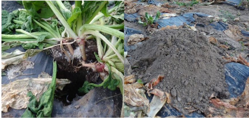
Dégâts de campagnols – Exemple de piège