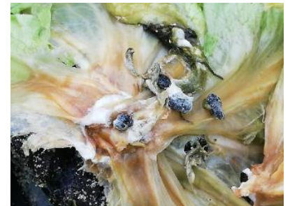
Sclérotines de Sclerotinia sclerotiorum sur laitue