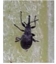
Apion adulte

Nous observons la présence d'adultes d'apions sur les plantes de parcelles qui n'auraient pas été protégées au moment du pic de population (fin octobre / début novembre). Les pontes impactant le plus les capitules au printemps ont déjà été faites, les adultes présents en décembre ne présentent pas un risque majeur pour la culture.