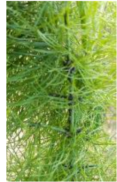
Puceron noir sur fenouil

- L'utilisation de moyens de bio-contrôle est possible. Liste des produits de bio-contrôle . Contacter votre technicien.