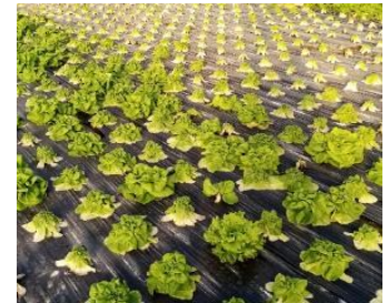
Parcelle attaquée par la fusariose sur laitue

La présence de fusariose (souche 4) est confirmée sous abri dans les Pyrénées-Orientales avec des dégâts pouvant aller de quelques pieds atteints à plus de 50% de la parcelle perdue. Des symptômes pouvant s'apparenter à la fusariose ont été observés sur plusieurs exploitations. Pour l'instant, les attaques sont surtout observées sur des exploitations spécialisées en salades (rotations peu diversifiées). La sensibilité des variétés à cette maladie est très variable. La prophylaxie est le meilleur moyen de lutte actuellement.