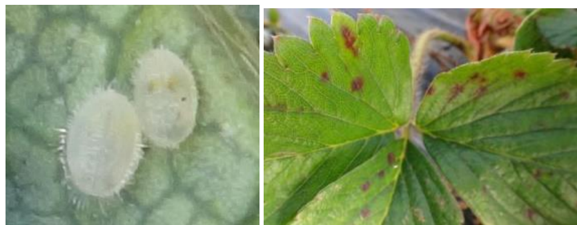
Larve de trialeurodes

On note la présence de quelques taches d'oïdium d'hiver.