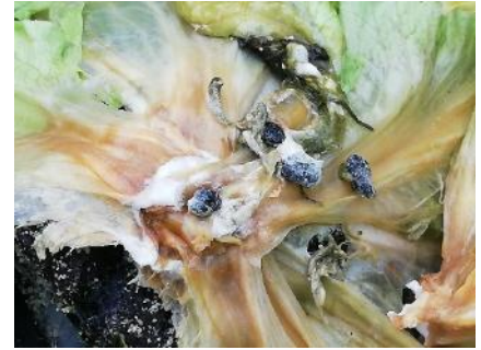
Sclérotines de Sclerotinia sclerotiorum sur laitue

Évaluation du risque : Risque en augmentation