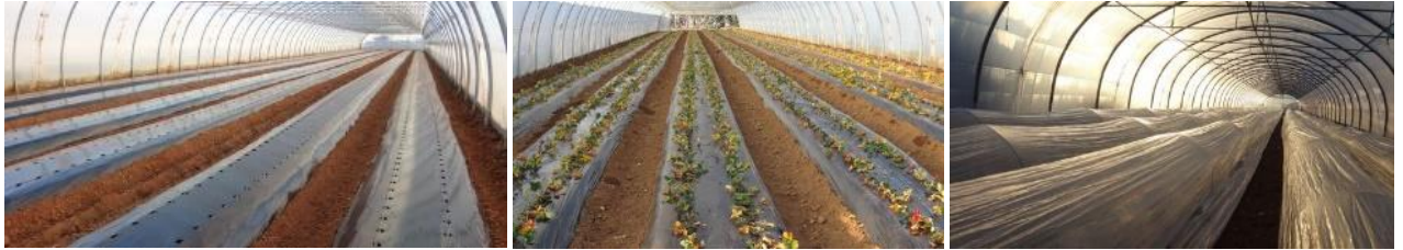
Préparation plantation TP – Trays plants juste plantés – Mise en place des chenilles – Photos CA 30