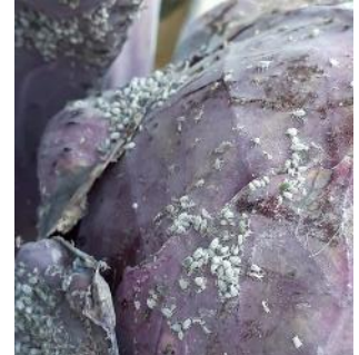
Puceron cendré sur chou

Voir la fiche « les auxiliaires sur choux »