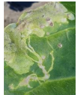
Galerie larve mineuse sur blette

- L'utilisation de moyens de bio-contrôle est possible. Liste des produits de bio-contrôle . Contacter votre technicien.