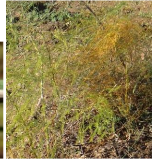
Rouille sur asperge