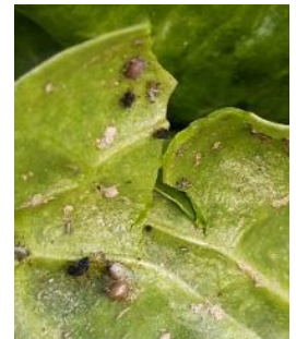
Pucerons parasités sur blette