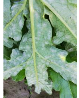
Oïdium sur artichaut