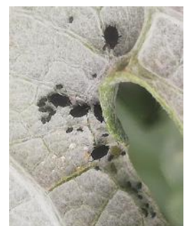
Puceron noir ( Aphis fabae ) sur Artichaut

La pression du puceron vert est forte cette année, notamment en Agriculture Biologique. Cependant, les populations sont en diminution avec la baisse des températures, le travail des auxiliaires et le développement des entomophthorales (champignons parasites des pucerons)