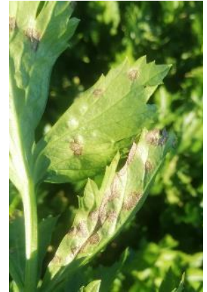
Septoriose sur céleri