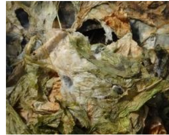
Botrytis – Sclérotinia – Photos CA30