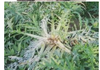
Trace de sanglier – plante mangée par un sanglier – Photos CA 66