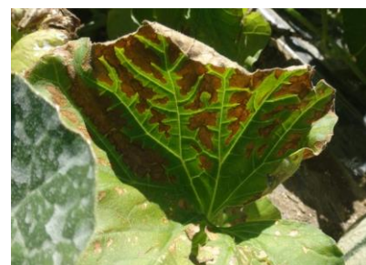
Grille physiologique - Photo CA30

Techniques alternatives : Pour limiter la grille physiologique, il faut assurer une alimentation correctrice en magnésium (nitrate de magnésium ou sulfate de magnésium) en application foliaire.