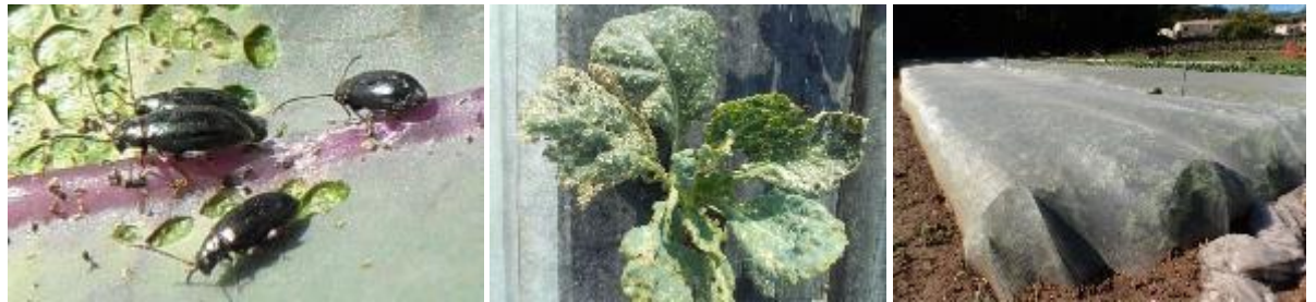
Altises et dégâts d'altises (à gauche et au centre) - Filet de protection (à droite)

Techniques alternatives : sur jeunes cultures, possibilité de mettre un filet de protection