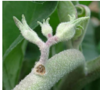
Lygus et dégâts - Photo CA30