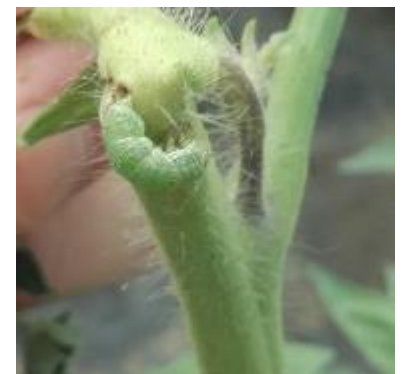
Noctuelle sur tomate

Techniques alternatives: L'utilisation de moyens de bio-contrôle est possible et efficace sur cette cible : http://agriculture.gouv.fr/quest-ce-que-le-biocontrole . Contactez votre technicien.