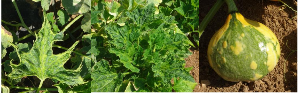
Virose sur courge.

Évaluation du risque : Risque stable pour les pucerons et très important pour les virus. Surveiller l'apparition des premiers des foyers pour privilégier une gestion localisée.