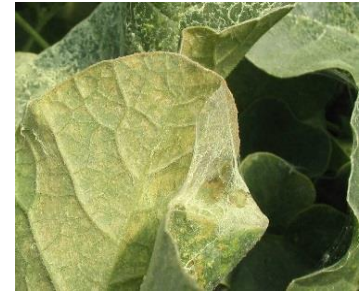
Acariens - Photo CA30

Évaluation du risque : Risque modéré à élevé selon les parcelles