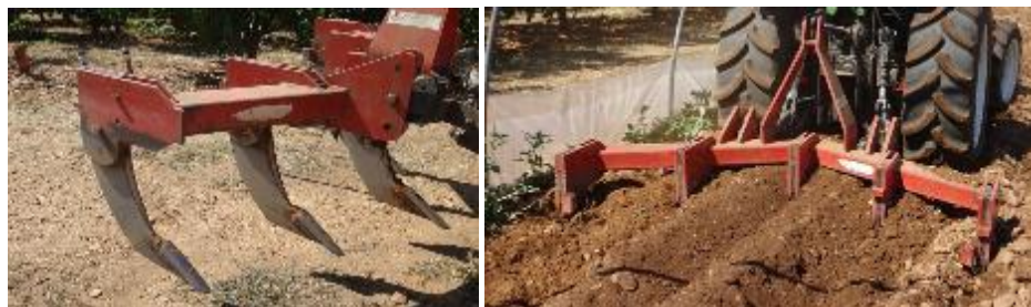
Travail du sol

Pour les tunnels qui ne seront plantés qu'en décembre, possibilité de faire un engrais vert après la solarisation pour maintenir et améliorer la fertilité des sols (25-30 kg/ha)