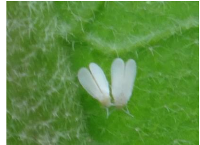
Trialeurodes vaporariorum - Photos CA30

Techniques alternatives : L'utilisation de moyens de bio-contrôle est possible et efficace sur cette cible : http://agriculture.gouv.fr/quest-ce-que-le-biocontrôle . Contactez votre technicien.