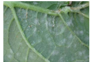
Oïdium sur courgette