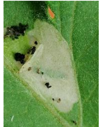
Dégâts Tuta absoluta sur tomate

L'utilisation de moyens de bio-contrôle est possible et efficace sur cette cible : http://agriculture.gouv.fr/quest-ce-que-le-biocontrole . Contactez votre technicien.