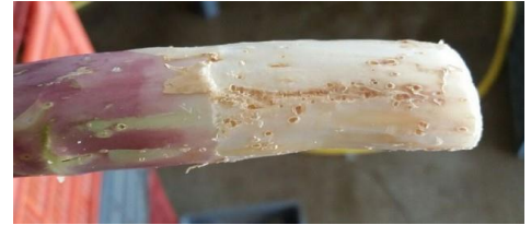
Dégâts Criocère