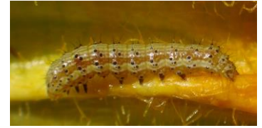
Noctuelle Photo CA30

Techniques alternatives : L'utilisation de moyens de bio-contrôle est possible et efficace sur cette cible : http://agriculture.gouv.fr/quest-ce-que-le-biocontrole . Contactez votre technicien.