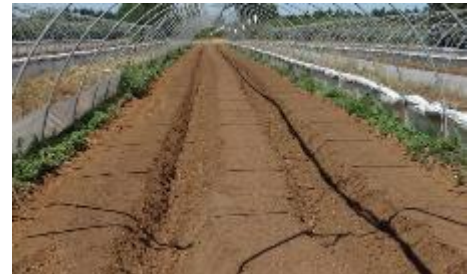
Buttes de fraises – Photo CA30

Pour ameublir l'horizon travaillé sans retournement ni enfouissement donc en maintenant la matière organique à la surface du sol il est conseillé de passer avec un outil de décompaction comme le chisel... avant de faire les buttes