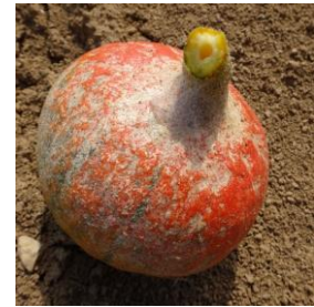
Dégâts acariens

Évaluation du risque : Risque moyen à important selon les endroits