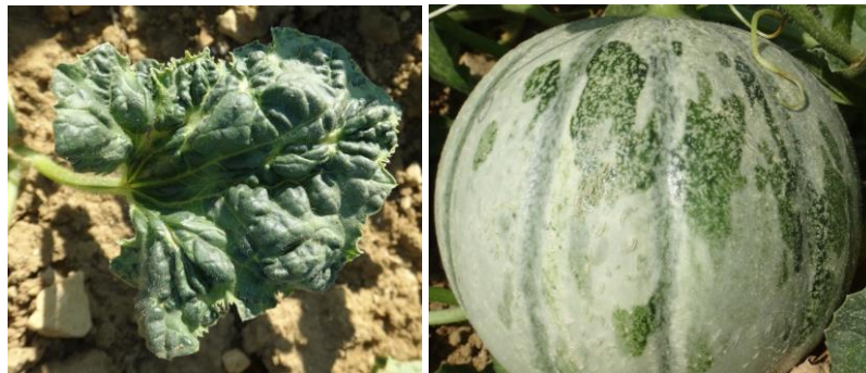
Virus sur melon

Mesures prophylactiques : il faut être vigilant pour détecter les premiers foyers et arracher les plants infestés puis surveiller leur évolution.