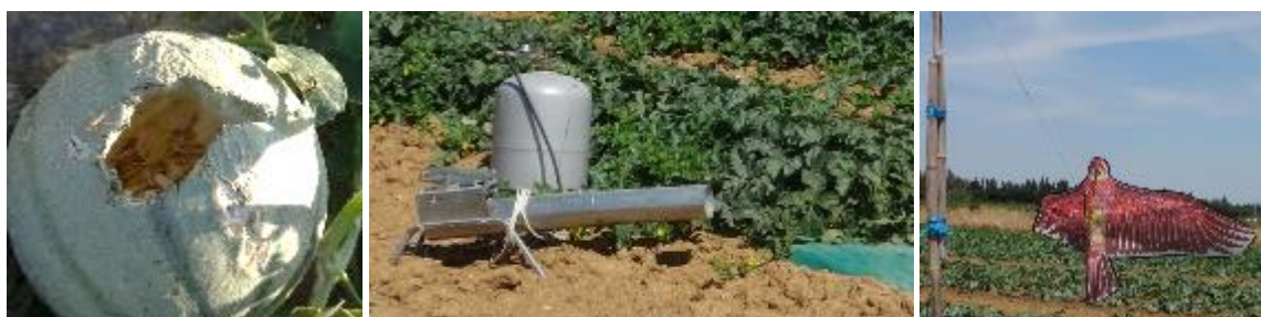
Fruits abîmés par les oiseaux (à gauche) et systèmes d'effarouchement à gaz (au centre et à gauche)

Techniques alternatives : Il est possible d'utiliser des effaroucheurs à gaz pour les faire fuir