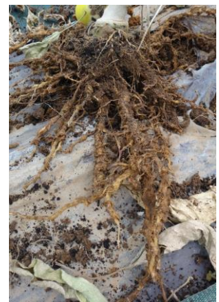
Dégâts nématodes sur aubergine