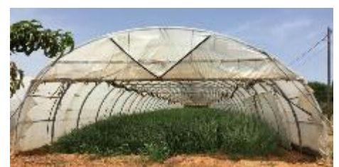
Sorgho sous abris

Pour les tunnels qui ne seront plantés qu'en décembre, possibilité de faire un engrais vert après la solarisation pour maintenir et améliorer la fertilité des sols (25-30 kg/ha)