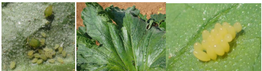
Foyer de pucerons (à gauche), symptômes de virose (au centre) et œufs de coccinelles (à gauche)

Les pucerons se développent beaucoup (même sur de très jeunes plants) mais toujours 2 cas de figure. Dans certains cas nous avons même une explosion des populations qui deviennent difficilement gérables car nous n'avons que peu de produits disponibles. Nous observons également beaucoup de virus avec des sensibilités variétales marquées.