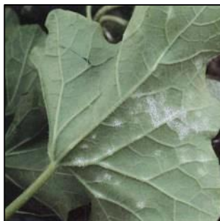
Taches d'oïdium à la face inférieure d'une feuille de melon

Lutte alternative : Il est possible d'utiliser de l'huile essentielle d'orange douce