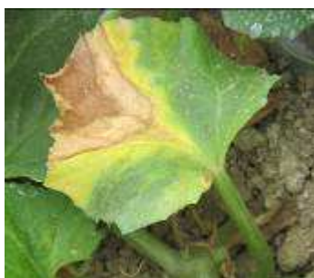
Jaunissement internervaire du limbe en forme de « V ».

Pour l'instant, aucun symptôme de verticilliose ( Verticillium dahliae ) n'est détecté mais le risque va augmenter. En cas d'attaque, les plantes atteintes flétrissent aux moments les plus chauds de la journée puis les feuilles jaunissent, se nécrosent et meurent. Les hyphes du champignon envahissent les vaisseaux de la plante ce qui gêne la circulation d'eau. La plante réagit en bouchant ses vaisseaux pour arrêter le champignon.