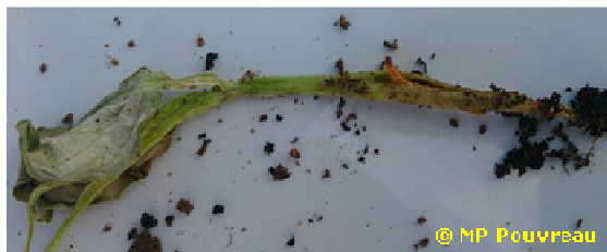
Dégâts provoqués par les larves de taupins

Quelques cas d'attaques de limaces (attaquant le collet des plants) et de larves de taupins sont observés.