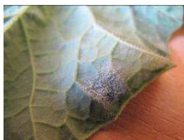
Oïdium à la face inférieure d'une feuille de melon

Des cas d' oïdium sont observés. Il faut donc être vigilant actuellement.