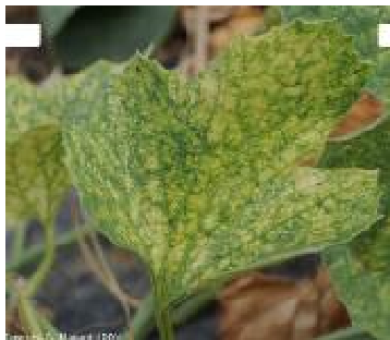
Symptômes d'acariens: Source: http://ephytia.inra.fr

Les foyers d' acariens ( Tetranychus spp. ) sont très fréquents. Pour détecter les premiers symptômes il faut inspecter les feuilles à la base des plants qui sont les premières atteintes. Les feuilles chlorosées sont couvertes d'une multitude de petites lésions chlorotiques à blanchâtres occasionnées par Tetranychus urticae (tétranique tisserand).