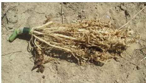
Cause des dégâts observés : système racinaire envahi de galles ( X. Dubreucq ).

Des dégâts de nématodes à galles ( Meloidogyne spp. ) sont détectés dans certains tunnels.