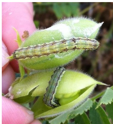
Chenilles d'H. armigera dans gousses de pois chiche

Le suivi de ce ravageur est réalisé avec des pièges en végétation qui permettent de détecter la présence de papillons et suivre les vols. Pour 2020, 34 pièges sont déployés sur le territoire.