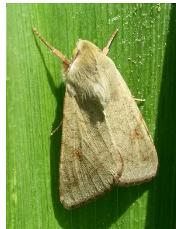
Papillon d'H. armigera - Ph Papillon d'H. armigera