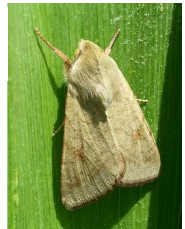
Papillon d' H. armigera - Ph Papillon d' H. armigera