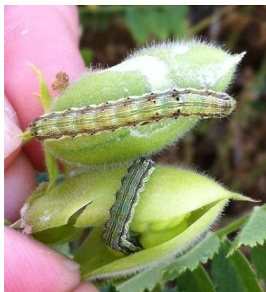
Chenilles d' H. armigera dans gousses de pois chiche

Le suivi de ce ravageur est réalisé avec des pièges en végétation qui permettent de détecter la présence de papillons et suivre les vols. Pour 2020, 34 pièges sont déployés sur le territoire.