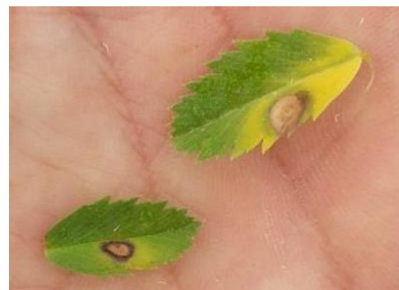
Symptômes d'ascochytose sur feuilles

La période d'observation habituelle de la maladie se situe autour de la floraison. Les symptômes de l'ascochytose sont reconnaissables grâce aux nécroses avec cercles concentriques de pycnides sur feuilles, tiges et gousses (voir photo ci-contre). La maladie se conserve sur les résidus de culture et les semences.