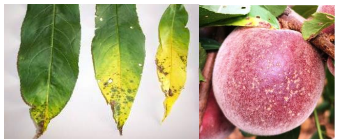
Symptômes croissants de Xanthomonas sur feuilles Symptômes légers sur fruit

Évaluation du risque : Période d'extériorisation des symptômes.