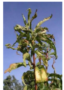
Pousse attaquée par la cicadelle verte

Période de risque : les populations sont abondantes à partir de juin-juillet, occasionnant alors des dégâts sur pousses.