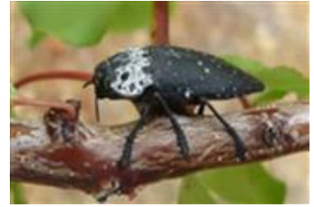
Capnode du pêcher adulte (CA34)

Mesures prophylactiques : éliminer les adultes détectés sur les arbres.