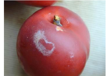
Attaque de thrips californien sur épiderme de nectarine