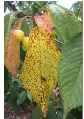
Taches sur feuilles de cerisier dues à la cylindrosporiose (CA34)

Évaluation du risque : Période d'extériorisation des symptômes en cours.