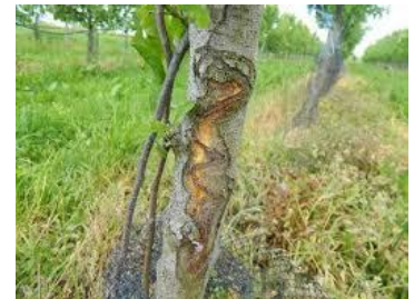
Dégât d'agrile du poirier sur un axe