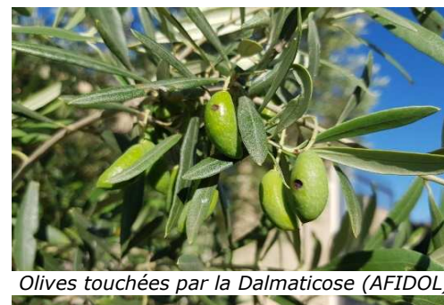
Olives touchées par la Dalmanose (AFIDOL)

Risque plus élevé dans les parcelles sensibles, irriguées et non protégées contre la mouche de l'olive.