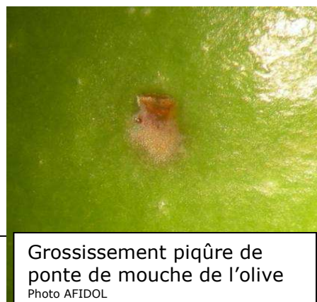
Grossissement piqûre de ponte de mouche de l'olive