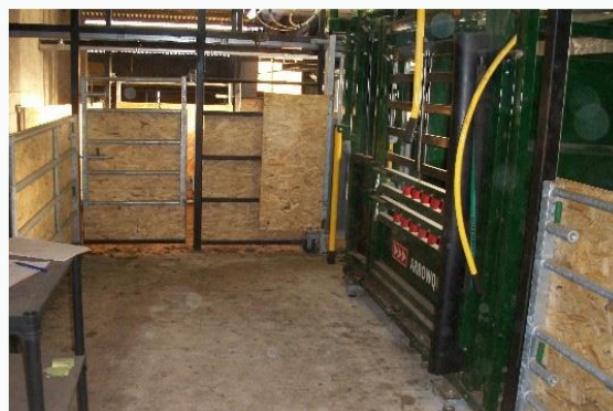
Couloir de contention rotatif et bascule

Grâce à ce dispositif, nous pouvons facilement diriger les animaux vers le quai de chargement et charger les veaux dans la bétailière sans aucune difficulté. »