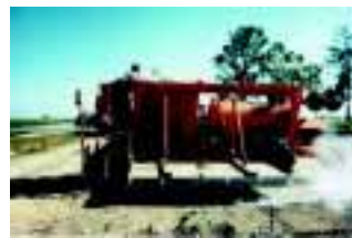
Appareil de désinfection vapeur

Ces méthodes consistent à élever la température du sol à des niveaux létaux pour les nématodes (de 40°C à 60 °C).