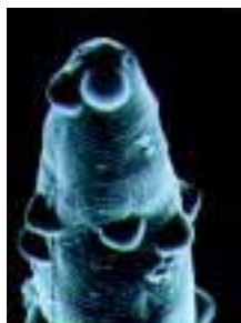
Spores bactériennes sur nématodes

Pasteuria penetrans est une bactérie qui parasite très efficacement les nématodes : la réduction de la population de ces ravageurs peut atteindre 80 %. Cependant, l'étroite spécificité des souches bactériennes et leur statut de parasite obligatoire sont des obstacles à leur utilisation pratique.